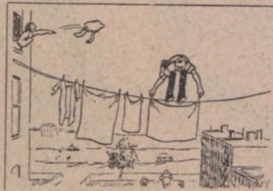
Nagytakarítás a kötéláncosnál