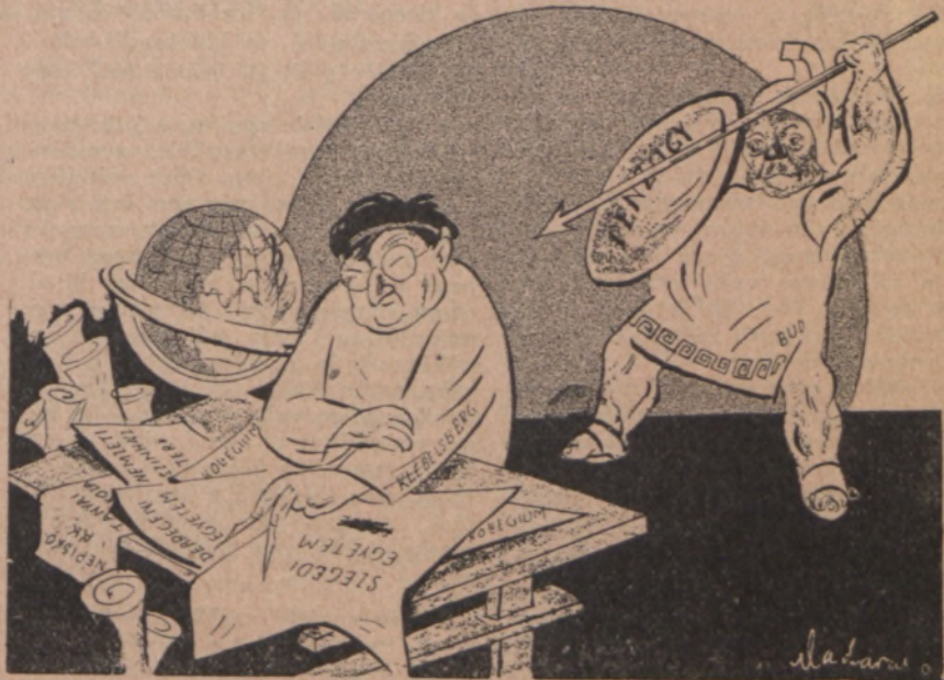
KLEBELSBERG-ARCHIMEDES: Noli tangere!...