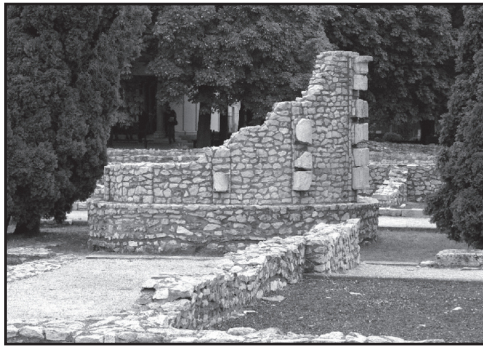
Aquincumi hűs piac

tet, mert Hajnóczi Gyula tárgyi bizonyíték nélkül kiemelte a kör alaprajzú kis mérlegház felmenő falazatát a romok közül, és a helyszínen megtalált féloszlopokat a megemelt pa-