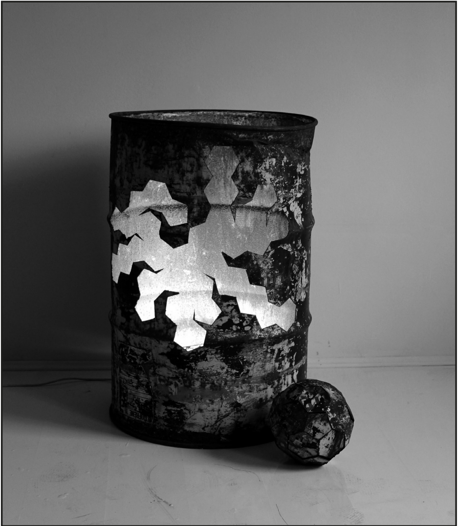
Szalay Péter: Óraszerkezet