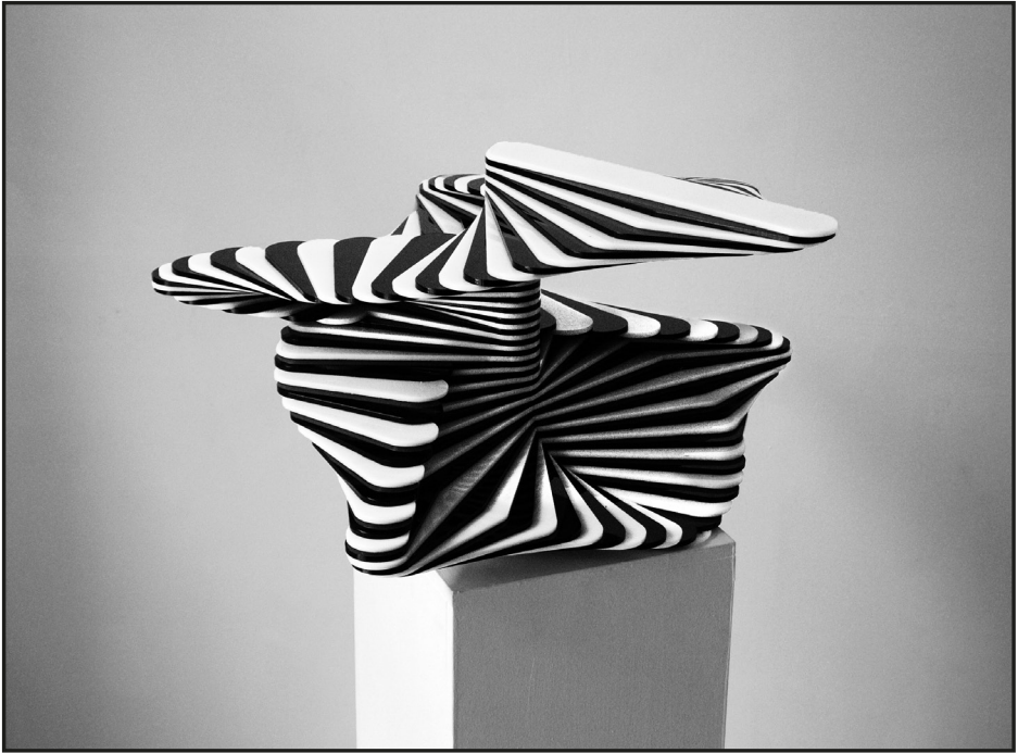
Szalay Péter: 24 órás szobor