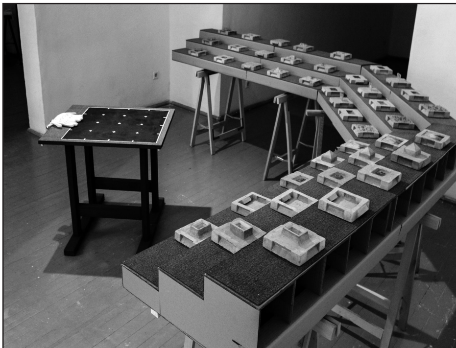
Kádár Emese: Betonpixelek