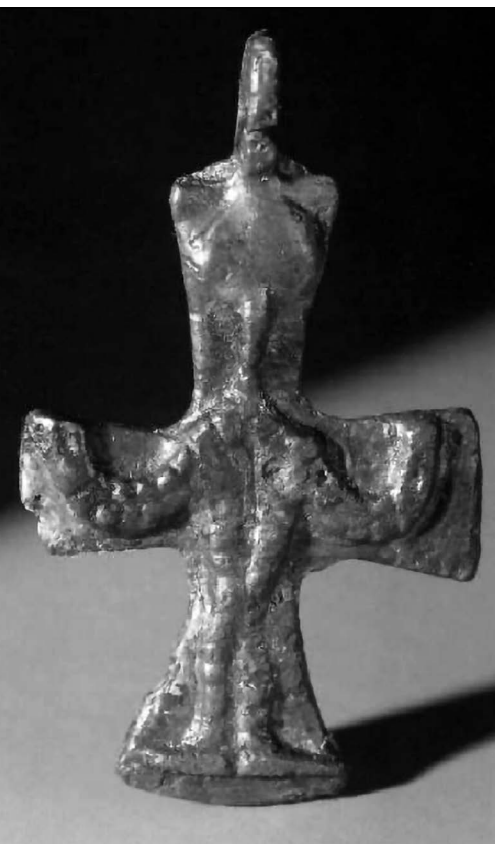
Honfoglalás kori mellkereszt

A szabadegyetem első évének előadásai a mondai történelem, s ezen belül is a magyar mitikus történelem világába vezetik be az érdeklődőt, mely a Makoldi-fríz értelmezése szempontjából döntő jelentőségű. A mondai-mitikus szemlélet nem az „oknyomozó” történettudománnyal szemben fejt ki mondandóját, hanem egy más nézőpontot jelent. Egy olyan valóságértelmezési gyakorlatot, mely a szikár történelmi adatokat, tényeket egy mögöttes, vagy „fölköttes” valóság keretei közé illesztve segít értelmezni, a hosszú távú folyamatokban az ismétlődést, a sorsszerűséget, azaz a Teremtő üdvtervét is érzékeltetve. Időszemlélete épp ezért nem vonalszerű, hanem körkörös, a mindennapokban is megtapasztalható természeti ritmusok, a ciklikusság emberi alapélményéből fakadó-