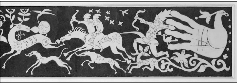
Makoldi Sándor – Túrinné Makoldi Gizella: A magyarság útja (A Nemzeti Művelődési Intézet homlokzati frízének részlete, sgraffito)