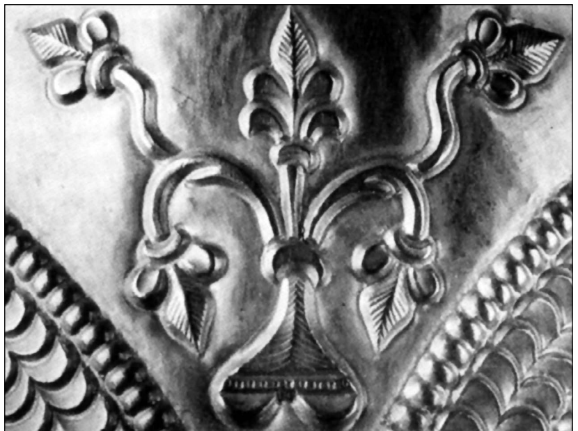
A nagyszentmiklósi kincs 2. sz. kancsójának életfa-képlete