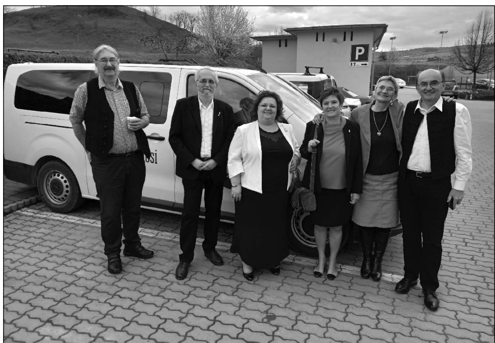
Székelyudvarhelyen vendéglátóink társaságában

– Az Intézet Szakkör programja sikeresen beindult Székelyföldön, az új érdeklődők száma megsokszorozódott, illetve ismertté vált, hogy az ősszel újra induló programra a székelyföldiek az Amóba Alapítvány,