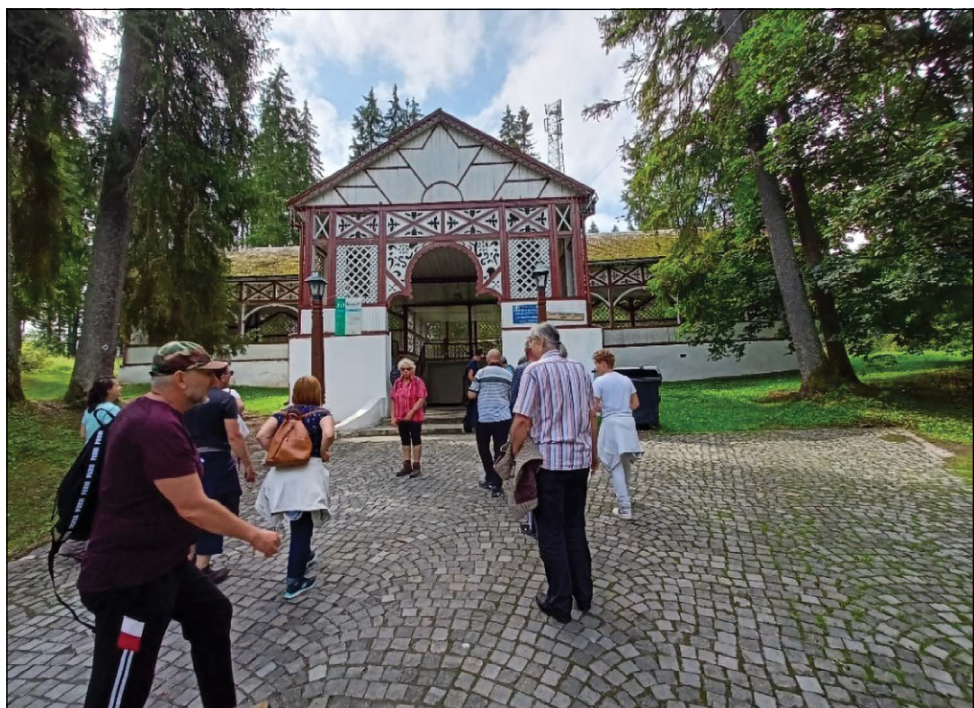
A tábor résztvevői a híres borvízforrások egyike, a Kossuth-forrás előtt

ben tévútnak, vagy legalábbis mellékvágánynak bizonyultak. Mivel egy nemzedékváltás kellős közepén vagyunk a szerves műveltség értékeinek örökítési folyamatában, így azt is kiemelte, hogy mindig a nemzedékváltások időszakában a legsebezhetőbb egy nemzet,