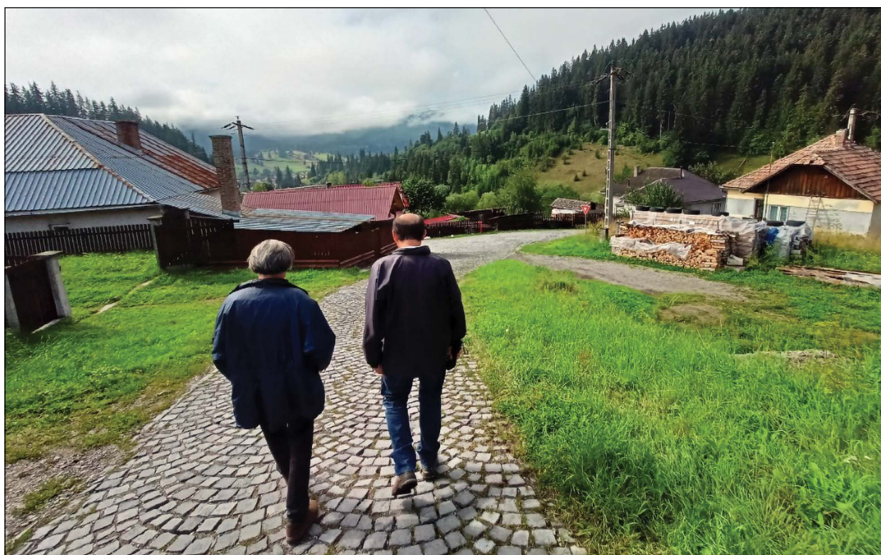
Borszék – A helyiek szerint tündérek lakják ma is e tájat...

re látogattak. A borszéki szerves műveltség tábor résztvevőivel a tábor második napján megismerkedtek az egyedülálló gyógyhatású borszéki vizek forrásaival, a lenyűgöző szépségű székellyi fürdőhely tündérkertjének csodáival. A nap Szántai Lajos előadásával zárult, melyben a 800 éves Aranybulla történelmi jelentőségéről beszélt, hangsúlyozva azt a kevésbé ismert tényt, hogy II. András törvénye voltaképpen az első olyan írott alkotmány, mely nem a király és a nemesség közötti magánjogi szerződést kodifikálja, hanem a Szent Korona közjogi tanában kifejeződő történelmi szokásjogi hagyományt rögzíti, vagyis az ősi szabadságjogokat erősíti meg.