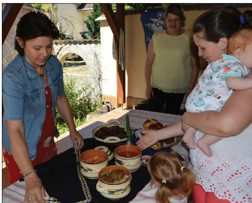
Tápláló ételekkel megtöltött komatálak

A kormány családbarát intézkedéseivel összhangban megvalósuló, a közösségépítő hagyományaink újraélesztése érdekében meghirdetett Kárpát-medencei komatál program újabb mérföldköhöz ért a komatál közösségeket megszólító felhívással és a kapcsolódó honlap elindulásával. A közösségépítő fo-