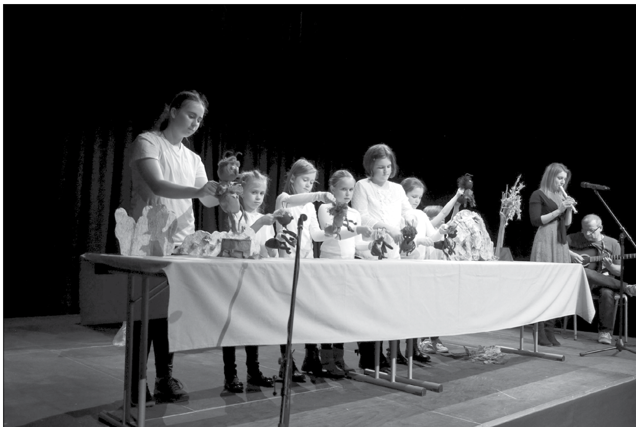
Fellépés a II. Bűvös Bábos Szemlén

A közösségek építése a közművelődés szakmai köreire kiterjedő mintaprogramjainkban is meghatározó, amelyek közül három szerepel a jelenlegi tematikus szám-