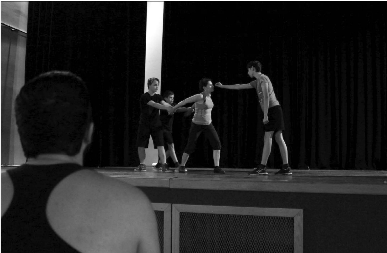
Főpróbán a pajtászínházi csoport

ban. A Közművelődési Foglalkoztatási és Képzési Program a szakmai munkatársak körének bővítésére és felkészítésre vonatkozó mintaprogramként valósult meg. A szakmai munkatársak támogatását folyamatosan biztosítjuk a JógyakorlatOn online felülettel, amely hatékony mintaprogramjává vált a tapasztalatok átadásának többféle forma ötvözésével: települési és közösségi jogyakorlatok videóbemutatóival, tájékoztató előadásokkal, magazinműsorral és élő kérdés-felelet lehetőséggel is kiegészített havi szakmai tájékoztató műsorral. A szerves műveltség terjesztésére kollégium, szabadegyetem és tábor is szolgál a mintaprogramjainkban, amelyek már nem csak a közösségi művelődés szakembereinek, hanem minden, a szerves magyar műveltség iránt érdeklődőnek a közösségét építi.