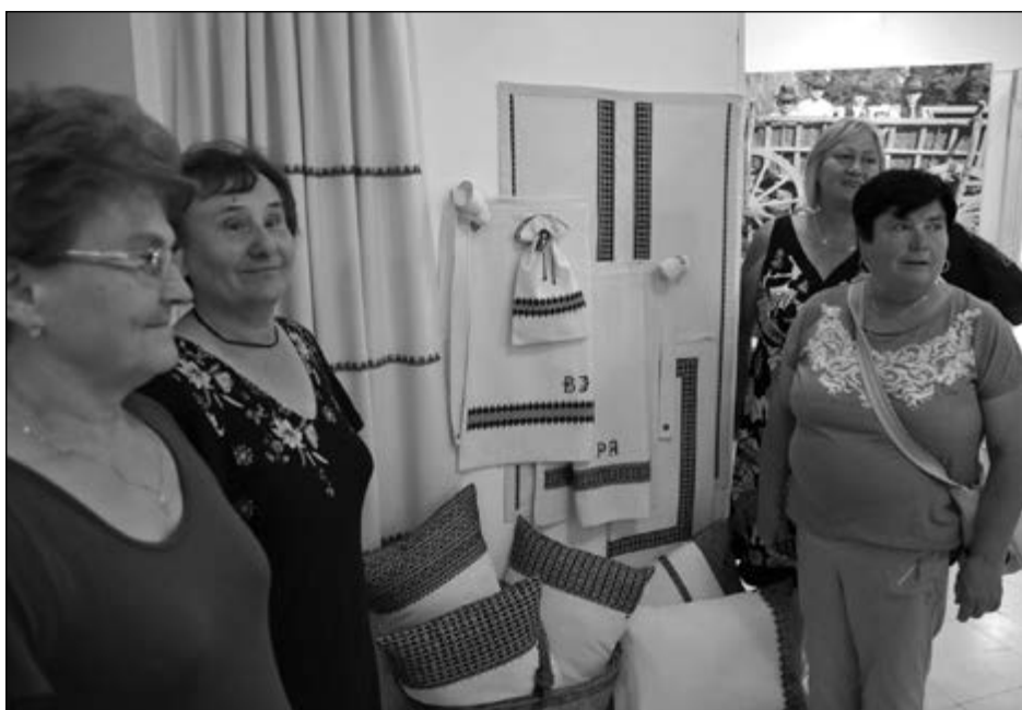
Mezőkövesd, 2019 – Kisjankó Bori Országos Hímzőpályázat, díjazott alkotások és a csoport

Megyei Igazgatóságán, egyik kiemelt feladatom a helyi értéktárak létrejöttének és működésének szakmai-módszertani támogatása. Ennek keretében folyamatos kapcsolatban álltam a Veszprém megyei települések nagy részével, több sikeres projekt valósult meg az értékfeltárással kapcsolatban. Az együttműködésnek köszönhetően kerestek meg Alsóörsről, hogy vegyek részt a nyertes hungarikum pályázat megvalósításában és szakmailag segítsem munkájuk