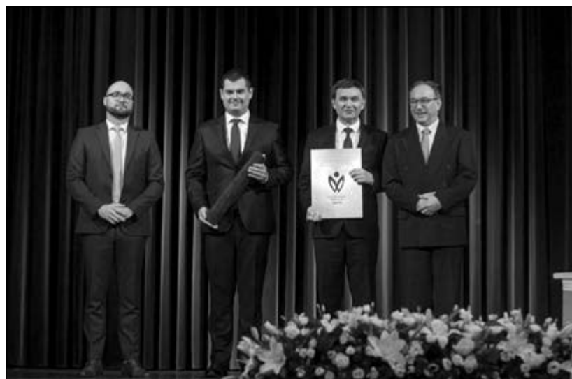
Magyar kultúra napja, 2020. január 22. – Uránia Nemzeti Filmszínház, a 2019. év Közművelődési Minőség Díj átadását követően

A folyamat előrehaladtával – a beküldési határidő közeledtével – az egyéni felkészítés igénye egyre növekedett és folyamatos volt az