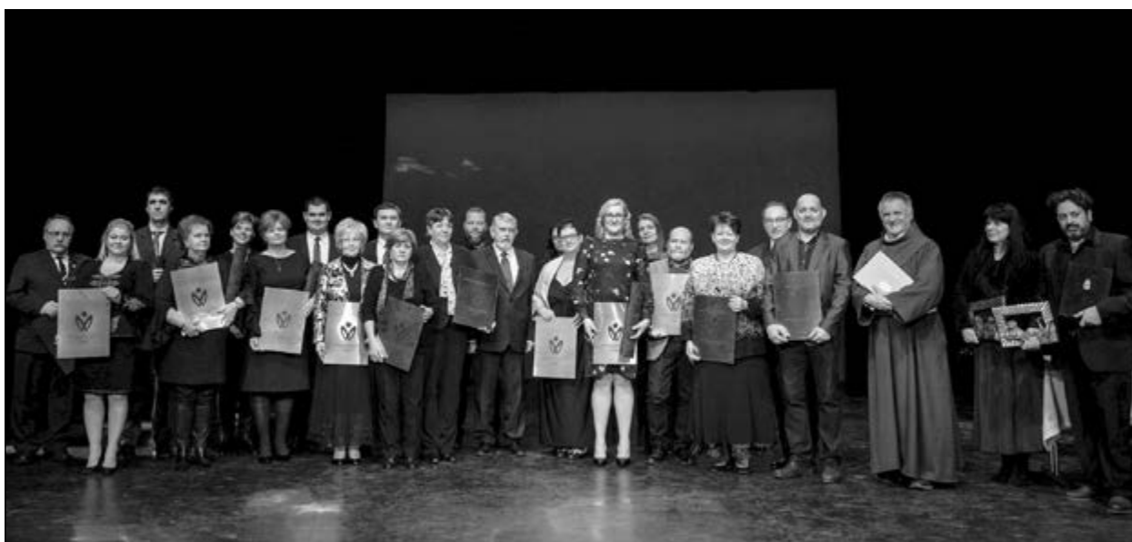
Magyar kultúra napja, 2019. január 22., Hagyományok Háza, csoportkép a 2018. év díjazottjairól

eredményesebben készülnek fel, melyek a pályázat benyújtása előtt legalább egy naptári évvel hoznak arról döntést, hogy pályázatot nyújtanak be.