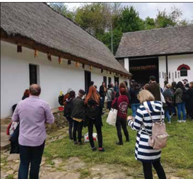
6. kép: Német Nemzetiségi Tájház meglátogatása a magyar-német kulturális terepgyakorlat keretében (Ófalu, 2019. május 1.)