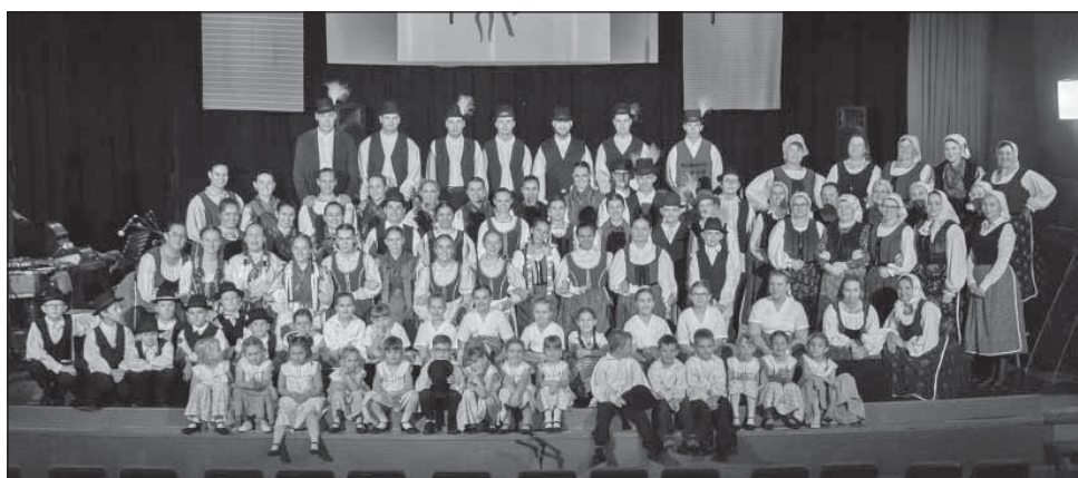
Pántlika Néptánc Együttes

A város számára különösen fontos ez utóbbi feltárása és minél szélesebb körben való ismertté tétele. Együttműködnek a helyi citerások és néptáncosok csoportjaival. Lelkes és magas színvonalú tevékenységükkel jelentős mértékben hozzájárulnak a Tolna megyei kulturális szellemi örökség védelméhez.