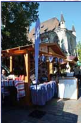
A Művelődési Intézet pavilonja

is szól. A rendezvényen a kiállított termékeket természetesen meg is lehetett vásárolni a helyi ízeket pedig megkóstolni. A gyermekeket játszótérre, a kultúra iránt érdeklődőket fellépők sokasága és kultúri filmvetítés is várta. Az NMI Művelődési Intézet – mint országos közfoglalkoztató – kiállítóként és programgazdaként is jelen volt a III. Országos Közfoglalkoztatási Kiállításon és Vásáron.