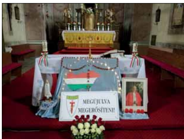
Nemzeti hőseinkre, nagyjainkra emlékezünk