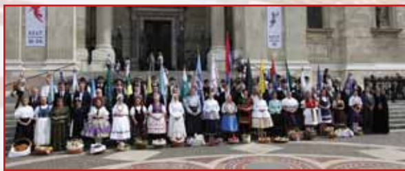
Megyei előljárók és népviseletbe öltözött kísérőik a terményáldást követő csoportképen

Nagy sikerrel zajlott le 2017. szeptember 9-én az NMI Művelődési Intézet és a Magyar Nemzeti Értékek és Hungarikumok Szövetsége, valamint a megyei önkormányzatok szakmai együttműködését reprezentáló III. Magyar Értékek Napja. A nemzet szellemi, tárgyi és természeti örökségéről teljes képet nyújtó értékünnep széles szakmai hálózat bevonásával, példaértékű ágazatok közti összefogással valósult meg. Az eseményen közel hatszáz fellépő, alkotó, kiállító működött közre, valamint hat határon túli régió értéktár-kiállításába is betekintést nyerhettek az érdeklődők. A III. Magyar Értékek Napja keretében megtartott, immár hagyományos terményáldás, a felvonultatott jellegzetes megyei termények és az egyes térségek hagyományait őrző népviseletek bemutatásával fenséges ceremóniává nemesedett. Az értékörzésre ösztönző eseménysor közel tízezer hazai és külföldi látogatót vonzott, akik reményeink szerint élményekkel és ihlettel feltöltődve vitték hírét az eseménynek és kultúránk sokszínűségének. Fotóválogatásunk az esemény hangulatába nyújt betekintést.