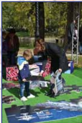
Oda kell figyelni a játszótérben