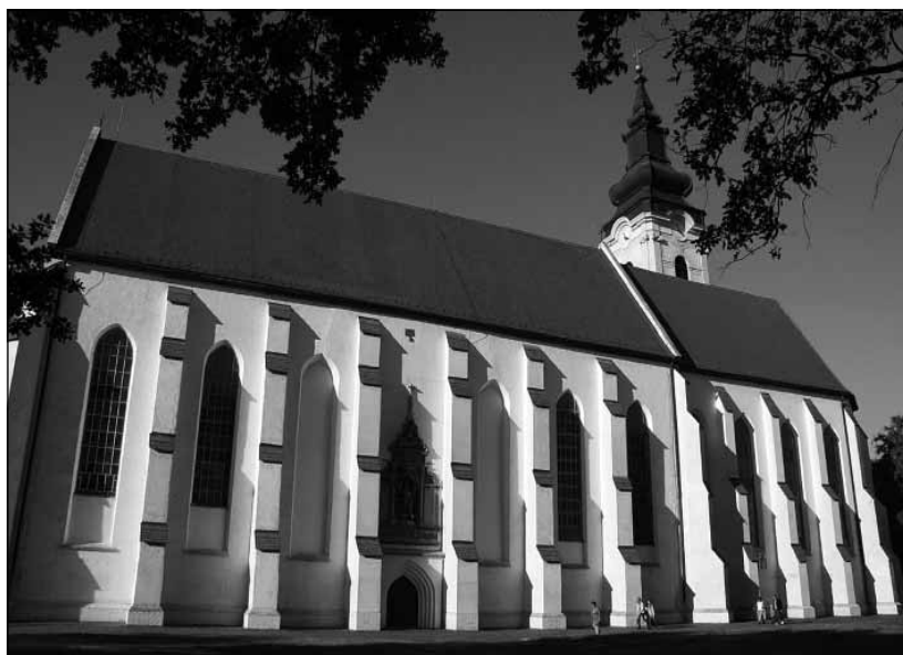
Szegedi ferences templom és kolostor

Ezen országos hatókörű egyesületeknek nem különböző programok szervezése a célja – azt megteszik a tagszervezeteik –, hanem a hasonló körülmények közt működő közösségek segítése. Erre azért van szükség, mert többségüket nem közművelődési szakemberek vezetik. A szakirányú képzettség nélküli lelkes szereplők tájékozatlanok a közművelődés ügyében. Kapcsolatok hiányában nincs módjuk ismereteik bővítésére. Nem járatosak a pályázati lehetőségek terén. Egy adott kezdeményezésben képesek figyelemre méltó eredményeket elérni, de nem tudják garantálni a fenntarthatóságot, a körülmények kedvezőtlen változásával pedig tanácsstalanná válnak.