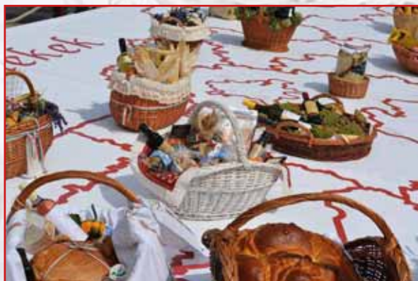
Szebbnél szebb terménykosarak díszítették Magyarországot térképét