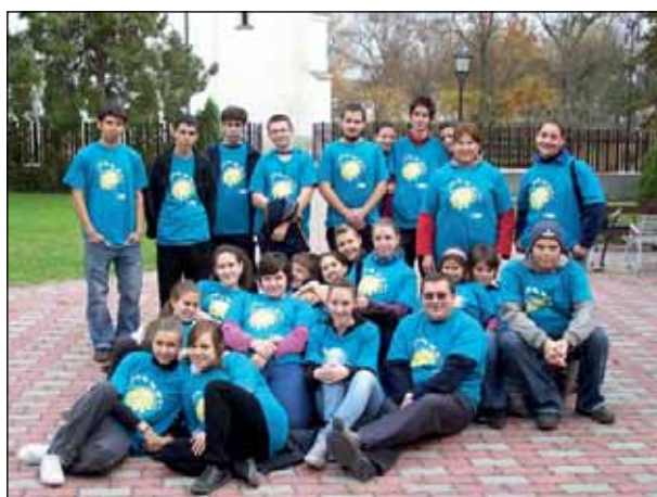
Önkéntesség a fiatalokkal