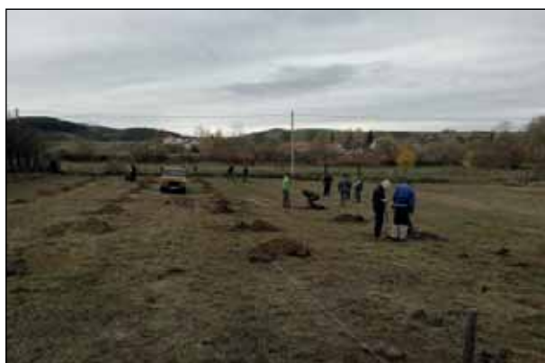
Őshonos magyar gyümölcsfák ültetése, 100 db