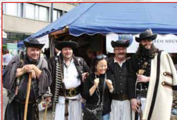
Sokan készítettek fényképet a bakonyi betyárokkal