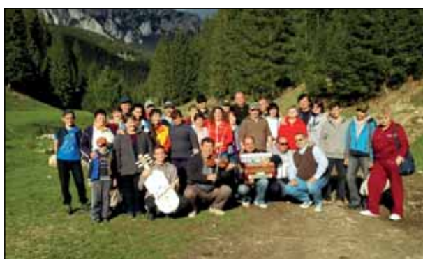
Kapcsolatépítés a Csíksomlyói KALOT Népfőiskolával