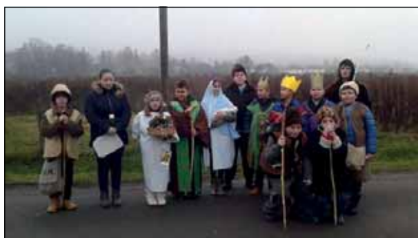
Népi értékek nyomában: betlehemezés