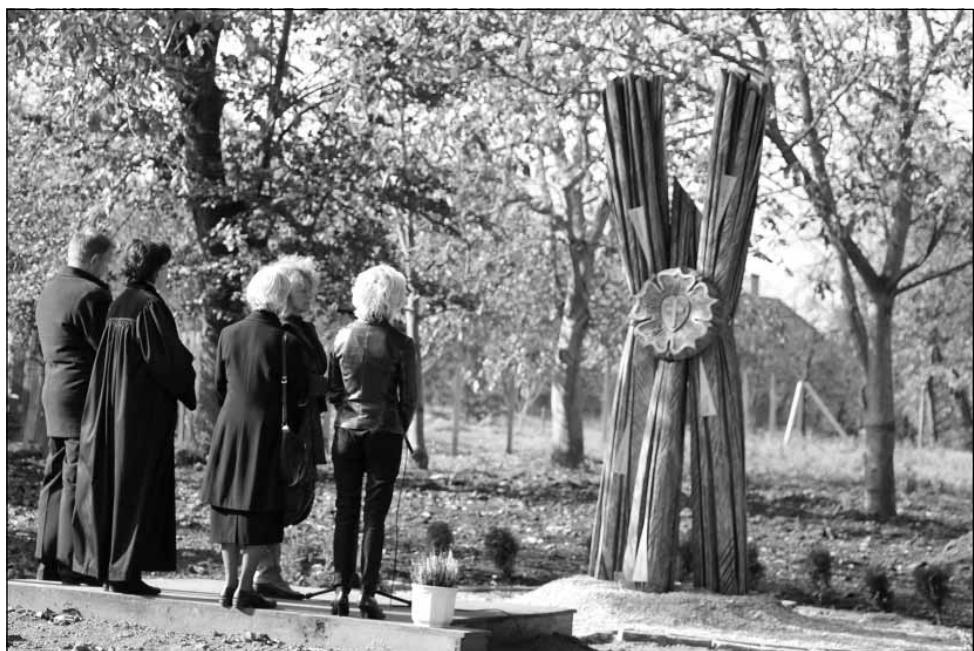
Reformációs emlékmű avatása

K. K.: Én személy szerint azt vallom, és arra próbálom mások figyelmét is felhívni, hogy az élet értelme az, hogy adunk. Adunk a másoknak önmagunkból, erőforrásainkból, hogy segítsük; gyengeségeinkből pedig azért, hogy érezze, szükség van rá, tartozik valahová. Ha játszunk kicsit a közösség szavunkkal, fellelhetjük benne a „közös ég” kifejezést. Az egymásra odafigyelő, együttműködő személyiségek fellett van az egyként képviselhető, közös érték, amelynek oltalma alatt megszületik egy közös elképzelés, ezt együtt megvalósítják, és ettől jobbá válik, értelmet nyer az egyén élete. A közösség elfogad, és ettől biztonságban érezheti magát annak minden tagja.