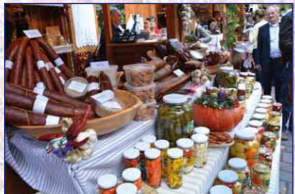
Ízelítő a kiállítás gasztronómiai kínálatából