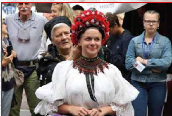
Készülődés a népviseleti bemutatóra