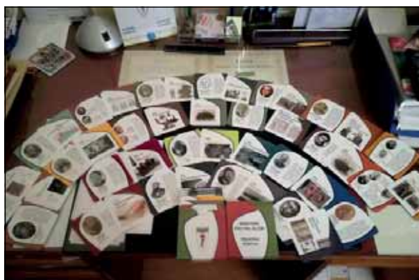
XIX. századi híres magyarokról készített kvíz kártya

Képek a KALOT Katolikus Népfőiskolai Mozgalom életéről, kapcsolatairól