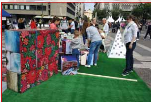
A legkisebbek játszóházban ismerkedtek az értékekkel