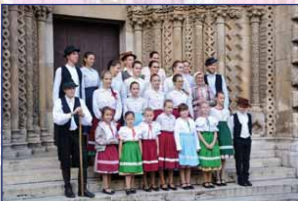
A nyírteleki Guzsalyas táncgyűttes a fergeteges fellépés után