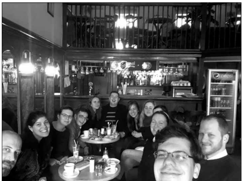
Szólj be a papnak!

T. G.: A programok a másik nagyobb eszköze az egyetemi lelkeszt-