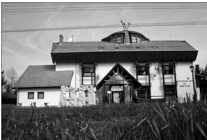
A Gencsapáti Művelődési Ház és Könyvtár

Szülőfalumban, Tornyiszentmiklóson a fiatal legények nem csupán bálókba jártak. Szinte mindenkinek volt borospincéje a hegyen, nyaranta hol az egyik, hol a másik pincénél gyűltek össze a falubeliek. Ezeket az összejöveteleket