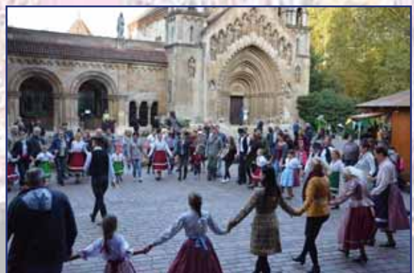
Táncszállal zárult az első nap