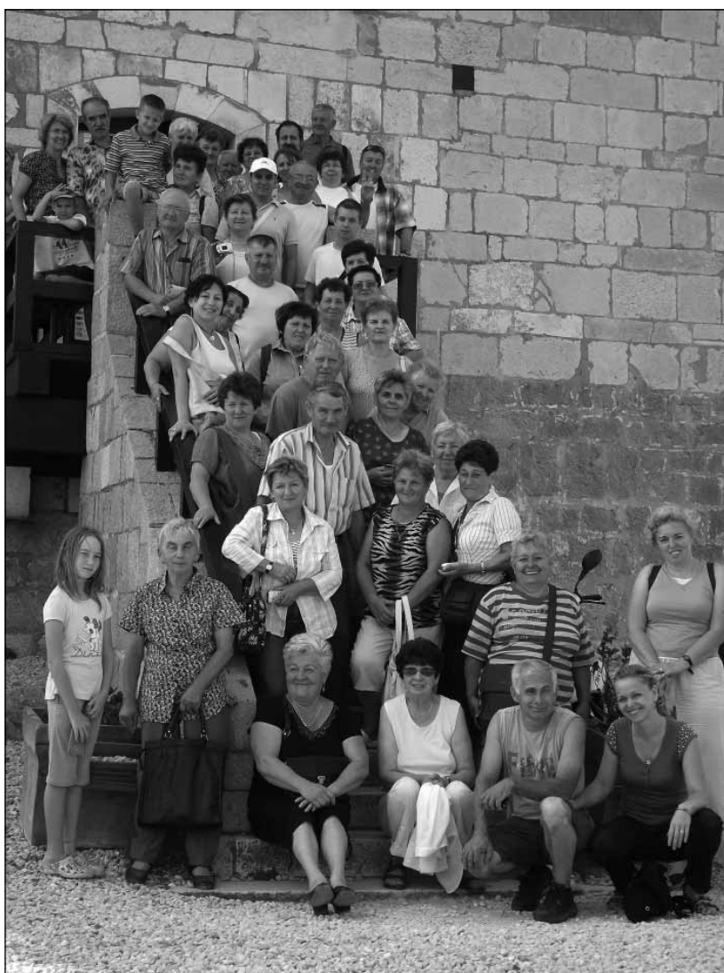
Kirándul a gyülekezet

Közösség nélkül elmagányosodik, elsovrad a lélek.