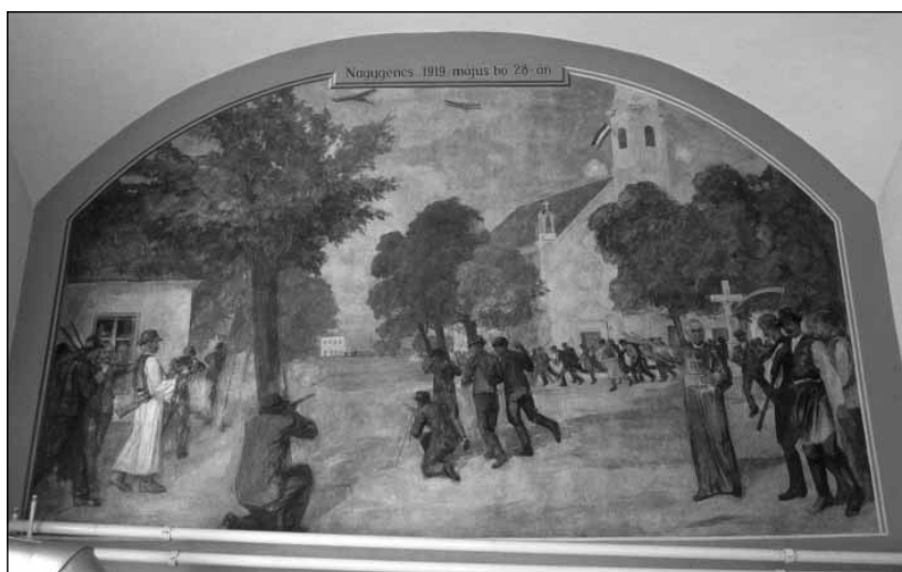
Nagygyencs, 1919. május 28.