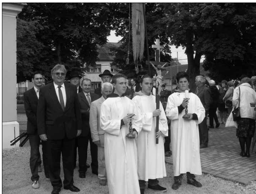
Körmenet a bádokereszthez

szomorú eseményeknek a tanúja volt a négy hársfa átívelése alatt álló faluvégi fakereszt.”