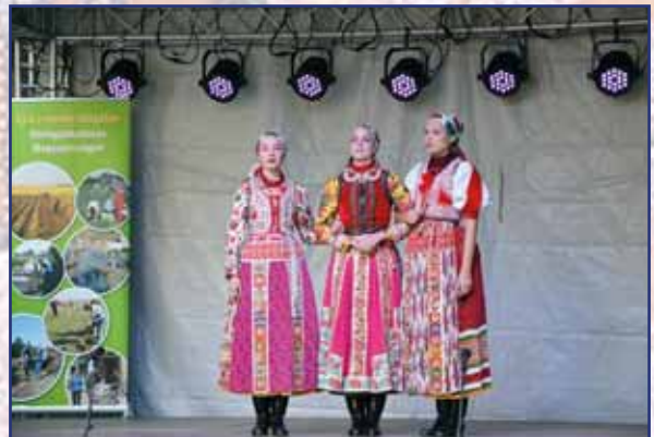
Csongrád megyét a deszki Tiszavirág együttes képviselte