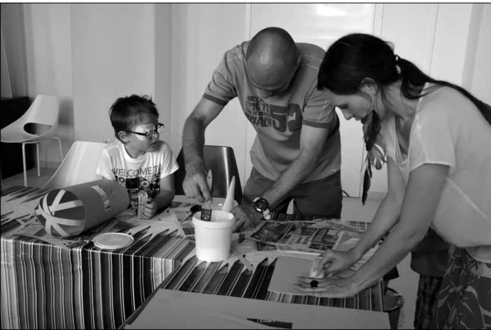
Nyári tábor, 2015

jelentős részének, a maradandó értékű történeti dokumentumoknak a hosszú távú megőrzése. A magyar levéltárhagyomány elmúlt évtizedek során végrehajtott legnagyobb szervezeti változása nyomán a közfoglalkoztatásban rejlő lehetőségek önálló foglalkoztatóként való kihasználása olyan cél, amelyet az országos lefedettséget biztosító intézményrendszerben valósítunk meg.