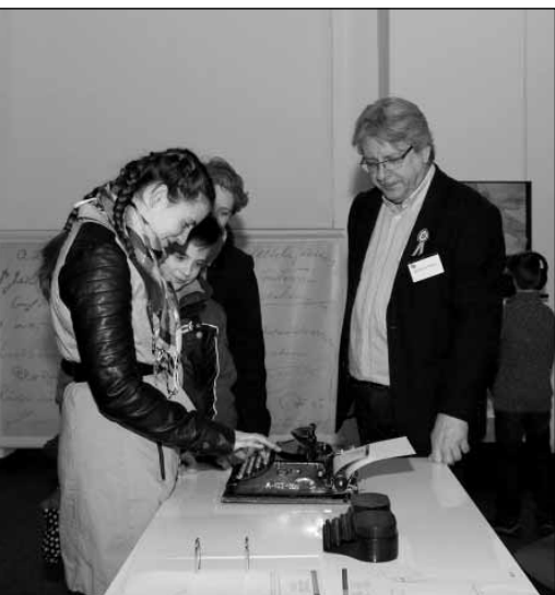
Huszártábor a Levéltárban

sőbbi korok számára; az általa őrzött levéltári anyaghoz – fokozottan alkalmazva az információs technológia által nyújtott lehetőségeket – egyre szélesebb hozzáférést biztosít az érdeklődők számára (iratok digitalizálása, adatbázis-készítés); a különböző rendezvények, kiállítások, konferenciák révén megismerteti a társadalommal a levéltár szakmai tevékenységét.