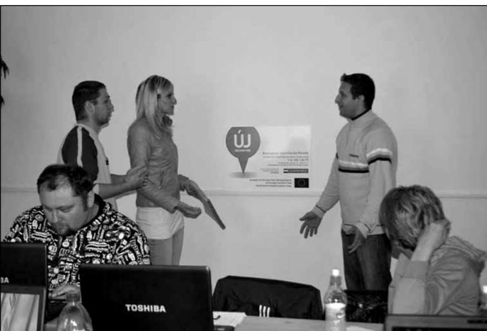
A szakmai képzést a cigándi Városi Könyvtárban szervezte meg a képző intézmény, a sárospataki A Művelődés Háza és Könyvtára

A program szakmai céljai között kiemelten szerepel a települési közösségi művelődési alkalmak szervezése, általában a közösségek fejlesztése. Az elvárások szükségessé tették az azonnali „munkakezdet”, és a program indulását követően néhány héttel megszerveződtek az első rendezvények. Bizonyos esetekben a munkatársak bekapcsolódtak már futó települési rendezvények előkészítő munkálataiba. Ezt azonban nem előzte meg semmilyen igényfelmérés. Erre kellő felkészítés után 2013 nyarán került sor, ahol is közel hatszáz strukturált kérdőívet vettek fel a munkatársak a Bodrogköz területén. Mindezt kiegészítették ún. fókuszcsoportos beszélgetések szervezésével is. 12 A kutatás elsődleges célja nyilvánvalóan a művelődési szokások és kulturálódással, közösségi alkalmakkal kapcsolatos igények felmérése volt. Az eredményeknek és az időközben folyó rendezvények tapasztalatainak összevetése képezte azután a 2014-re elkészített munkaterv alapját. Külön kell megemlíteni, hogy a felmérés másodlagos hozadékként a munkatársak