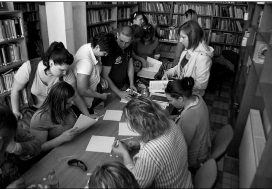
A könyvtári képzési modul gyakorlata. A „bip-esek” a pácini könyvtárat rendezik közös erővel

tartsuk. Így a csapat tagjai megismerhetik egymás munkakörülményeit és települését is.