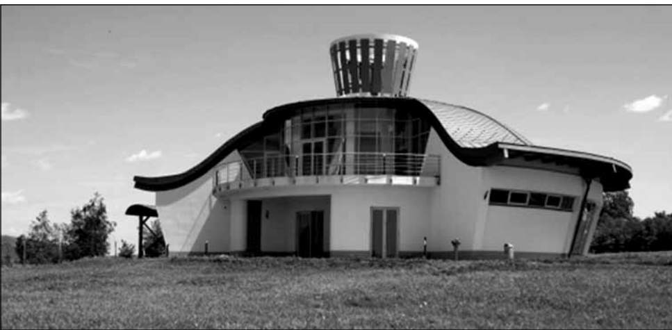
A karsai honfoglalás kori látogató központ

A fenti társadalmi mutatók elsődleges oka nyilvánvalóan a megélhetési nehézségekben keresendő. A mezőgazdasági termelés struktúrájának kilencvenes évektől kezdődő teljes átalakulása párosult a kistermelői szektor visszafejlődésével. Ennek eredményeképpen a munkanélküliség folyamatosan nőtt, és kialakult egy olyan típusú mélyszegénység, melynek kezelése messze túlmutat a munkaügyi problémákon. Bár az elmúlt két évben – közfoglalkoztatás révén – a statisztikai adatok jelentősen javultak, ez nem eredményezte az életszínvonal javulását. A közfoglalkoztatásból származó jövedelmek a létfenntartáshoz éppen elegendő forrást jelentenek csupán. 5