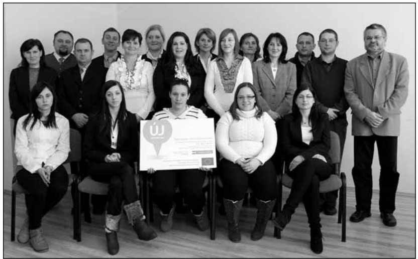
A „BIP-es” csapat a szakmai képzés záróvizsgáján készült közös fényképen

A pályázati dokumentációban megfogalmazott cél tehát összefoglalva: egy olyan közösségi, könyvtári, kulturális és információs szolgáltatásokat nyújtó, együttműködésen alapuló szolgáltatásrendszer létrehozása a Bodrogi közben, amely hozzájárul a települési lakosok életminőségének javulásához. Mindezeket túl a Bodrogi köz területére kiterjedő kétirányú