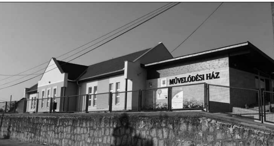
A bodroghalmi integrált közösségi szolgáltató teret 2013-ban újították fel.

A közkincs kerekasztal rendezvényei során merült fel először az az ötlet, hogy minden településen szükség lenne egy olyan munkatárs alkalmazására, aki a települési közösségi kulturális szolgáltatásokat szervezné. Ugyanakkor ezek a munkatársak hozzájárulhatnának a kistérségi információs hálózat működtetéséhez is. Ezen ötlet képezte a később kidolgozott és a leghátrányosabb helyzetű kistérségek támogatására létrejött (LHH) pályázati alaphoz benyújtott Bodrogközi Információs Pontok projekt alapját.