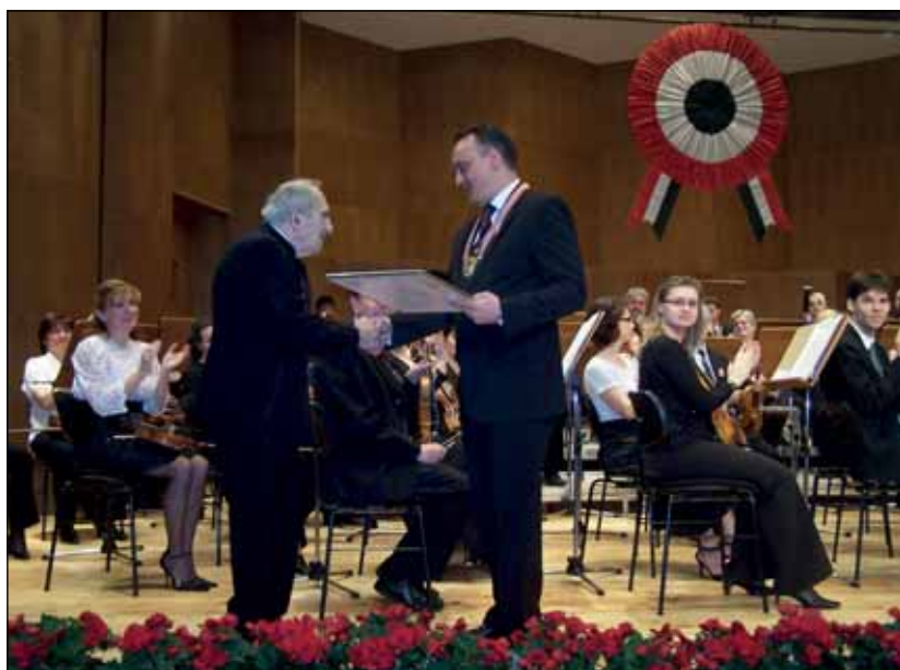
Díszpolgárság, 2009, díjátadó

B.H.: Szerencsére a mai napig alapkönyv édesapa „Néprajz az általános iskola kezdő szakaszában” című kézikönyve, ami segíti a néphagyományok továbbörökítését a legfiatalabbakra. Nem lehet szemet hunyni afölött, hogy a gyerekek ma már más világban él-