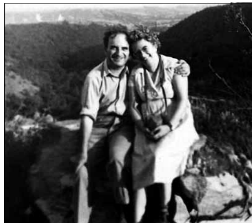
Kirándulás, hatvanas évek