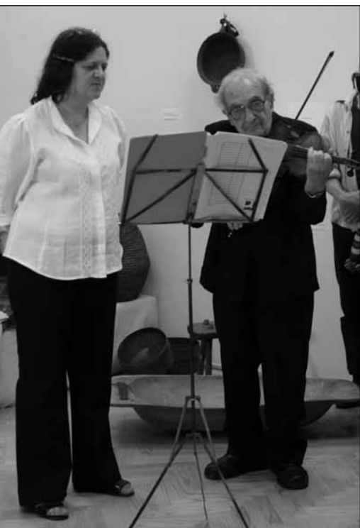
Polgárok Háza, Daloló Őrvidék

hányszor ezt mondtam, édesapa már vett is fel a nyakába, és énekelt nekem. Mesélik, mikor egyéves apróság voltam, sétáltunk Győr utcáin, én pedig kiköptem a cumit és halandzsanyelven, de tisztán eldaloltam egy-egy gyerekdalt – szinte mindet ismertem már addigra.