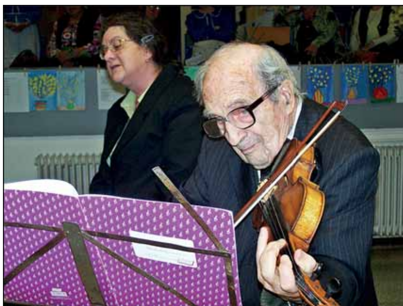
Tihany, KÓTA, 2012, fotó Birinyi József

nek: ha azt hallják, hogy „eladó lány”, akkor arra gondolnak, hogy biztos a Tescóban áll a sajtópultban. A népdalok, régi mesék, versek, még a nagy költőink művei is Petőfitől Adyig olyan szavakat használnak, melyeket nemhogy ők, de még a szüleik sem feltétlenül ismernek. Fontosnak tartotta, hogy a gyerekeknek ne csak tanítsuk a népdalokat és népi hagyományokat, hanem mellette ismertessük is meg őket ezzel a világgal, hogy meg is értsék! Ha nem érti, nem fogja szeretni.