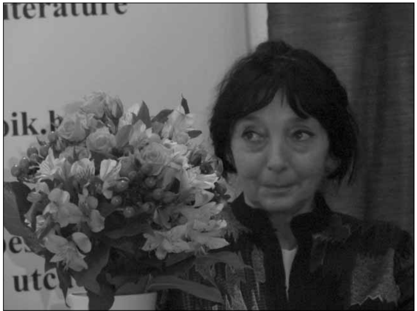
Könyvbemutató, 2013. november 19. Megkéssett tavasz, el se jött tél

kor nem akarnék írni. Ha az ember a gyerekével, az őhöz leginkább tartozóval, a tőle leginkább függővel, a rá leginkább utalttal nem a legjobb tehetsége, a legjobb akarása, a legjobb szíve és esze szerint tenne mindent, akkor miért lenne érdemes leírni egyetlen sort is? Bármit csak azért érdemes leírni, mert az ember gondolja valahogy a dolgokat, látja valahogy a dolgokat, érzi valahogy a dolgokat, ezek szerint él, s valami hirtelen olyan módon okoz benne feszültséget, hogy nem tudja másképp feloldani, mint hogy hagyja magából kiíródni. Valami megoldás az írásban akarja megmutatni magát, az elemek újra akarnak formálódni, a közlés szándékával. Ez mozgatja az embert.”