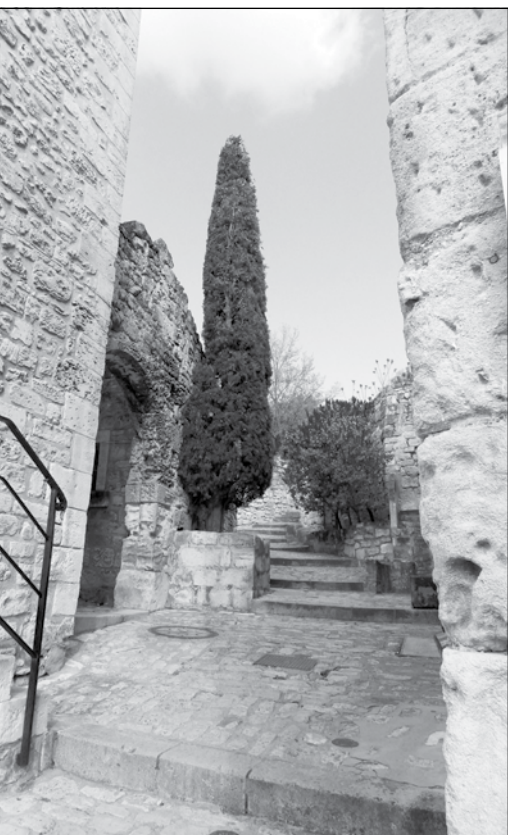
Les Baux de Provence

Fő tevékenységek az ifjúsági, sport, kulturális és oktatási ügyekkel kapcsolatos munka. 80 önkéntes foglalkozás-vezetőjük van. A házhoz 1974 óta