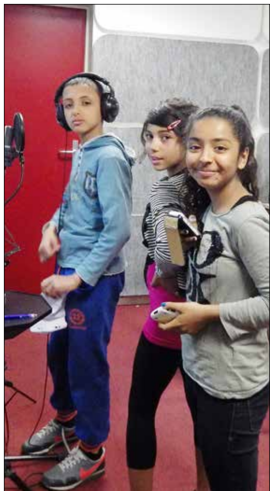
Salon de Provence, gyerekek próbálnak az Ifjúsági Ház stúdiójában.

A Nemzeti Művelődési Intézet által szervezett tanulmányút első lépése volt a francia-magyar szakmai, közösségi művelődési kapcsolatok újraélesztésének, a tervek szerint a látogatást a francia kollégák 2013 szeptemberében viszonyozzák.