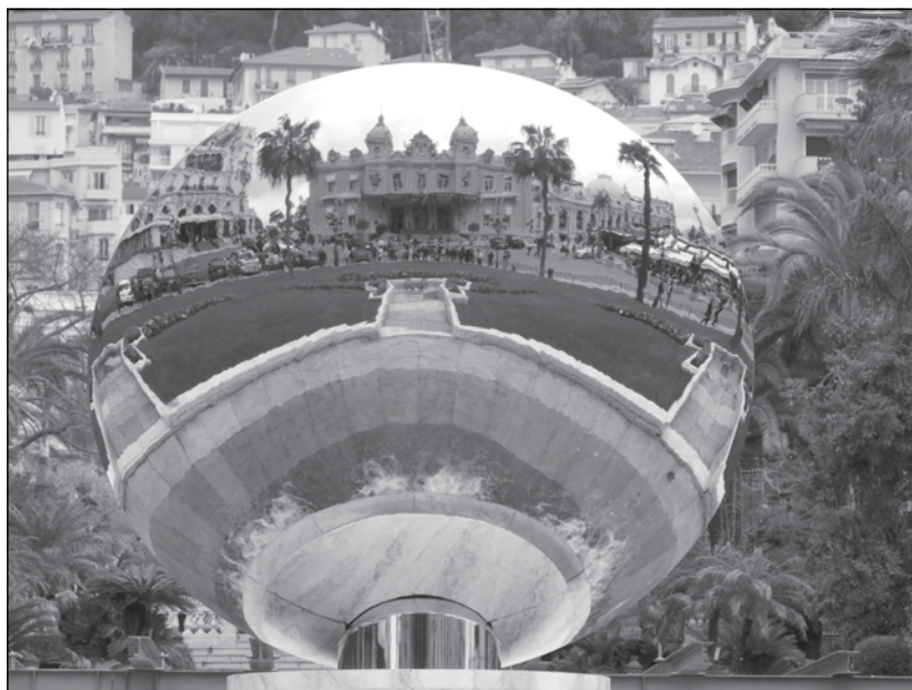
Monaco, a Kaszinó visszatükröződik a park fém félgömbjében.

Carcassonne a régió egyik kiemelt turisztikai központja is, az itt található vár az Unesco világörökségének része. Itteni látogatásunkat így egy helyi önkéntes idegenvezetése kíséretében a városban tett rövid sétával zártuk.