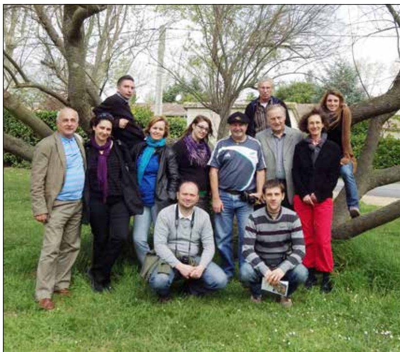
Belvèze-du-Razès-i Ifjúsági és Művelődési Ház kertjében a vendéglátóinkkal.

Délután Narbonne városban az MJC regionális egyesületének vezetőseivel találkoztunk.