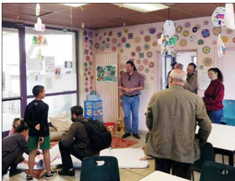
Avignon, tavaszi szüneti foglalkozások gyerekek számára az Ifjúsági Házban. Az ajtó mellett balra a ház igazgatója.

Elgondolkodtató, sorsszerű-e, hogy a magyarokat a többi népnél talán gyakrabban érik olyan helyzetek, amikor kényszerből, vagy jobb lehetőségként felvetődik az elvándorlás gondolata. Közösségfejlesztőként tudunk-e ez ellen tenni? S ha már valaki ezt a sorsot választotta, van-e olyan erős kötődése, ami később visszatérésre készíteti?