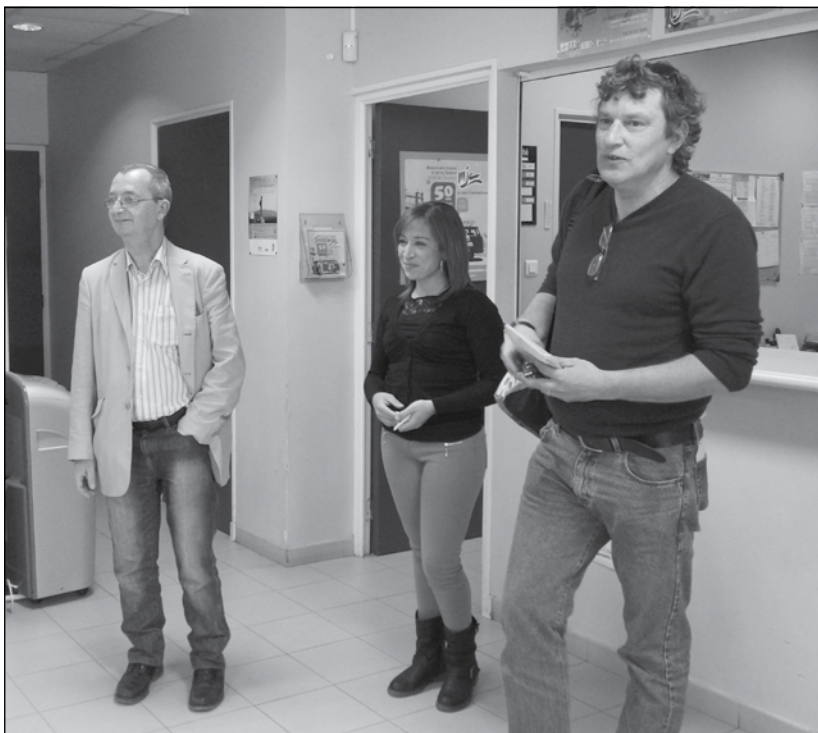
Salon de Provence. Jobbról balra: az Ifjúsági és Művelődési Ház igazgatója, animátora és elnöke.

Hosszas beszélgetést folytattunk arról a rendszerről, melynek köszönhetően a szakirányú végzettséggel nem rendelkező, de már legalább tíz éve akár önkéntesként is a szakmában dolgozó alkalmazottak szakmai tapasztalatát egy validációs eljárás keretében felsőfokú végzettségnek ismerik el.