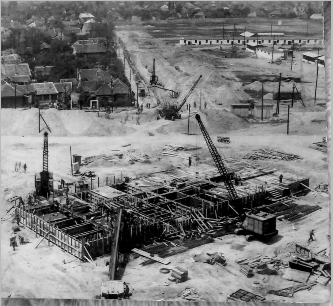
1970. április Nyírpalota utca 12-14.(4-es jelű épület)