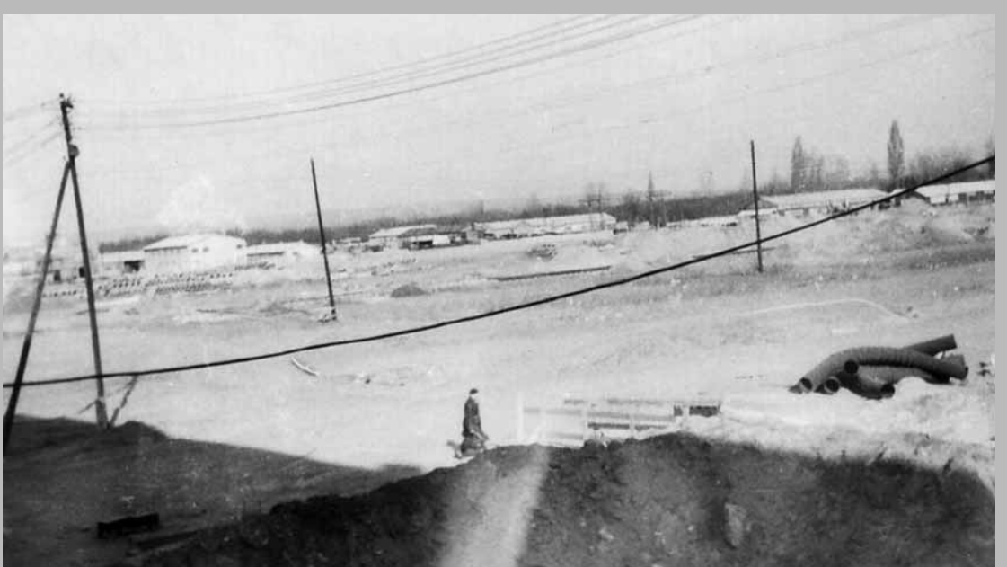
Távolban a FÖLDGÉP telephely látható. Felszabadulás út 160.

Most, amikor lassan ötven éves archívumok között lapozgatok és böngészem a fényképeket éjjelbe nyúlóan, jutnak eszembe a történetek, régen elfelejtett nevek. Régi kollégákkal jövök össze, hogy közösen idézzük fel a hőskort. A beszélő múlt újra átélhetővé eleveníti azt a mérhetetlenül sok igyekezetet, erőfeszítést, fáradságot, amely előre vitte a lakótelep megvalósítását. Nézegetjük a képeket a régmúltból. Szűz terepen vagy elvadult tájon, ahol az országépítő gondolat újat, hasznosat, nagyot akart teremteni, a Földgépesek voltak az elsők. Ővük volt az első kapavágás. Előregedett