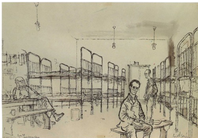
6. kép. Hálóterem a bécsi Karls-kaszárnyában. Webb–Searle, 1960b: 11.

Searle-ék az egyik legkiszolgáltatottabb és az emberekből a legtöbb együttérzést kiváltó menekültcsoportra, a kiskorúakra is felhívták a figyelmet. 27 Ennek azzal is