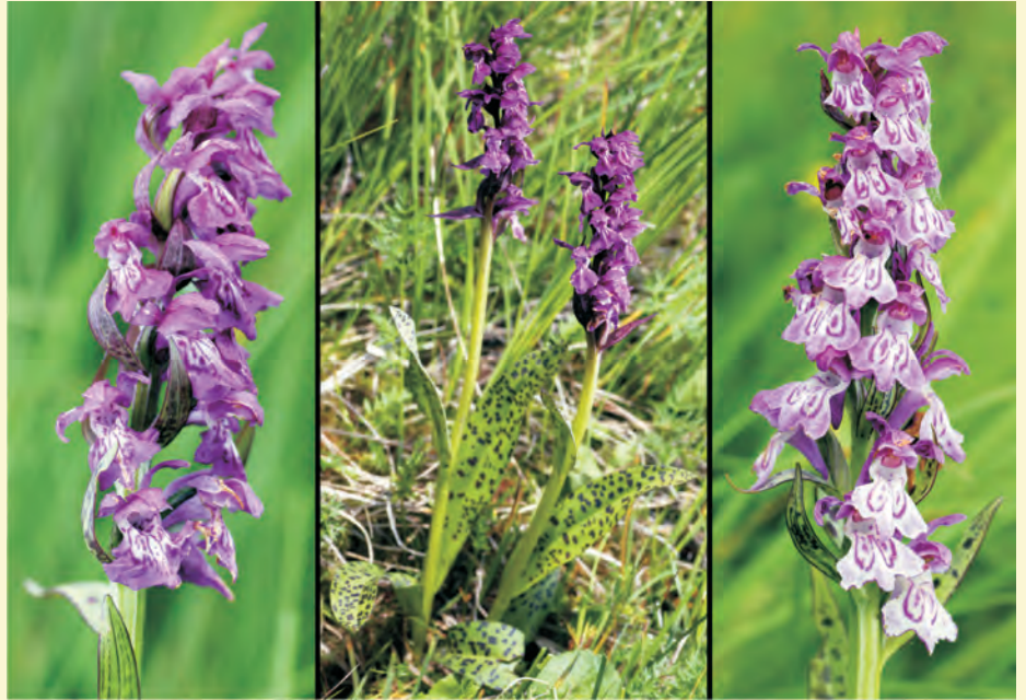
Székely ujjaskosbor a Madarasi Hargita Dagadó lápjáról.

Soó Rezsőről több mint ötven névenyt neveztek el. Eredményeit 29