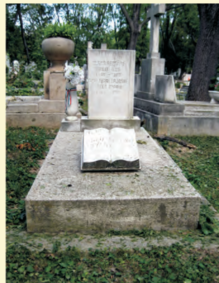
Soó Rezső és felesége síremléke Budapesten

A főcímben is szereplő mondása, életfilozófiája szellemében élt és alkotott: „Életem örök küzdelem volt önmagammal, feladataimmal, kör-