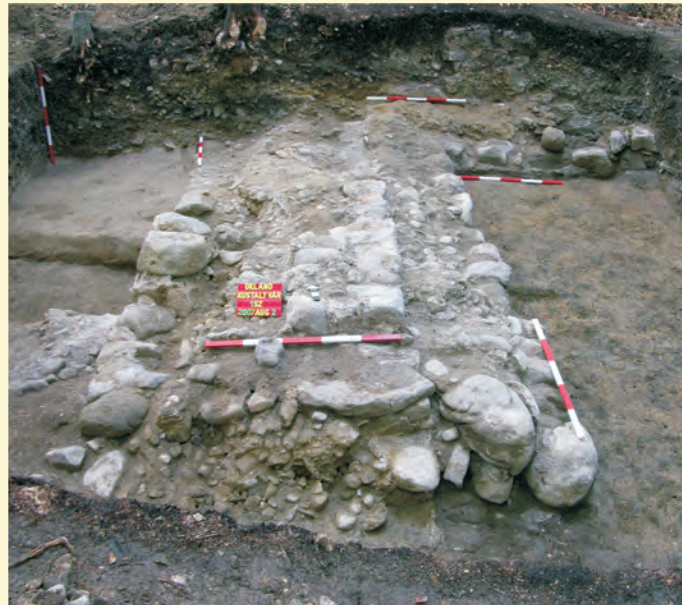
Kustaly várának bejárata, 2007. évi ásatás

Kustaly vára és a Rika erdei várak történeti szerepének értelmezéséhez Udvarhelyszék székelység előtti múltjába kell visszalépnünk. Szakirodalmi közhely, hogy Székelyudvarhely neve egy Árpád-kori királyi udvarhely nyelvi kövülete, melyet feltételelesen a késő középkori, fejedelemség kori vár helyére szokás lokalizálni. E királyi udvarhelyhez tartozó birtokok a későbbi Udvarhelyszék területének nagy részét magába foglalták. Szolgáltató népeire utaló helyneveken kívül, mint a Homoród menti Daróc (vadfogó), Lövéte (lövő) és a Küküllő menti Solymos (solymár), egy másik fontos tényező látszik ezt közvetve alátámasztani: a sóvidéki és Homoród menti sólelőhelyek. Azt hiszem, nem véletlen, hogy Kelet-Erdély és a későbbi Székelyföld sóbányáit magába foglaló területen jött létre a kora Árpád-kori királyi magánuradalom egyik legfontosabb erdélyi birtokteste, amelynek keretében a 12. században egy erdőispánságot szerveztek meg, központja alá rendelve a terület gazdasági erőforrásait és szolgáltató népeit. A későbbi Udvarhelyszék határain is túlnyúló erdőispánság fontos elemei lehettek a Rika erdei toronyvárak (hasonló toronyépületeket a Magyar Királyság északi erdőuradalmaiban, pl. Zólyomban találunk), melyek körzetében a régészeti feltárások által felszínre hozott állatsontok tanúsága szerint jelentős