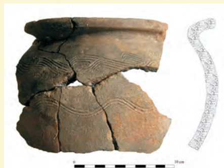
Árpád-kori fazék töredékei Kustaly várának építési szintjéről

A királyi birtok eladományozásának folyamatában a 14. századra a