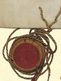
Apafi Mihály 1675-ben kelt adománylevele Katona Mihály javára (777. sz. irat)

A számos helyi közszerelőt adó homoródalmási Mihály család 14 levéltárából 116 irat került a múzeumi gyűjteménybe, ezek évköre 1706–1896. A család első jelentősebb tagja Mihály Máté kuruc kapitány volt, vélhetően az ő hagyatékából származik az állag első darabja: I. (Habsburg) József magyar király 1706-ban kiadott kiáltványának másolata, melyben az uralkodó az állam és a hadsereg iránti kötelezettségeikre figyelmezteti székely alattvalóit (1398. sz.). Mihály Máté fiától, Ferencről származnak az 1753–1780 közötti gazdasági jellegű feljegyzések (1404. sz.). A 18. század végén és a 19. század első évtizedében keletkezett iratok nagy valószínűséggel a család legkiemelkedőbb tagja, Mihály János (1771–1836) alkirálybíró, udvarhelyszéki adminisztrátor, országgyűlési követ, királyi táblai ülnök, székelykeresztúri unitárius gimnáziumi gondnok hagyatékából