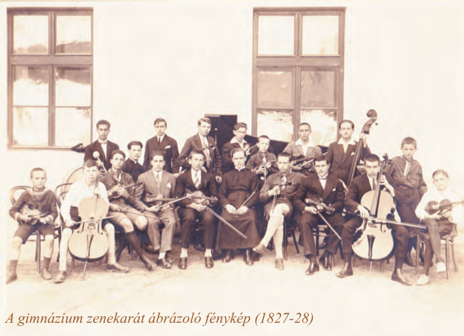
A gimnázium zenekarát ábrázoló fénykép (1827-28)