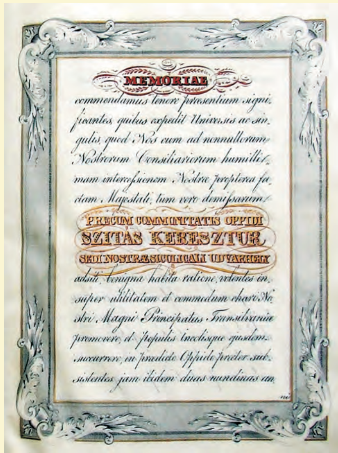
Székely(Szítás)keresztúr 1844. évi kiváltságlevele (1628. sz. irat)

Ilyen előzmények után került sor a bemutatandó iratcsoport első két darabjának a kibocsátására. Az első egy 1629-ben, Brandenburgi Katalin fejedelemszony uralkodása idején kelt ünnepélyes kialakítású, pergamenre írt tanúsítvány (1626. számú irat), melyben a gyulafehérvári káptalan rekvizitorai átírt alakban kiadják Báthory Zsigmond 1589. április 22-én, Tordán kelt azon confirmationalisát, melyben a fejedelem megerősítette a város Izabella királyné idején nyert és Báthory István által megerősített kiváltságait.