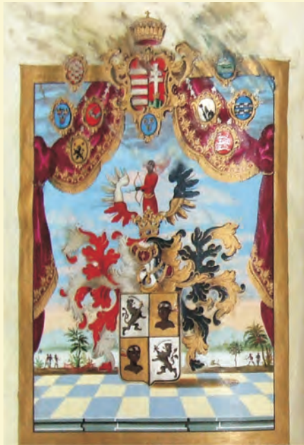
A Pozner család címere (Részlet a II. Habsburg Lipóttól 1791-ben nyert nemeslevélből)*

Az iratcsoport minden bizonnyal legértékesebb darabja III. (Habsburg) Károly királynak a szentgyházai és kápolnásfalvi communitas javára 1724. május 17-én Bécsben kibocsátott kiváltságlevele (982. sz.). A pergamenre írt ünnepélyes oklevél, melyen III. Károly és kászoni br.