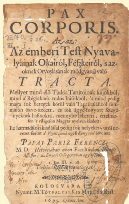
Pápai Páriz Ferenc: Pax Corporis. Kolozsvár, 1695.

Az óvintézkedések eredménytelensége újabb utasítások kibocsátására késztették a Főkormányzékot, amelyeket Udvarhelyszék előljáróságáéppen az említett napon (június 1.) továbbított a falusbírók számára. A parancs a vesztegzárak megerősítéséről, a fertőzött települések élelmezéséről, valamint a vásárok tartásának, a külső vásárokról való kijárásnak tilalmáról rendelkezett. 10 A Segesvárról kapott írásbeli jelentésre hivatkozva a főkormányzék utasítás szigorúan meghagyta, hogy a fertőzött helyekről senki, mások csak a német katonai hatóságoktól vagy a főkirálybírótól szer-