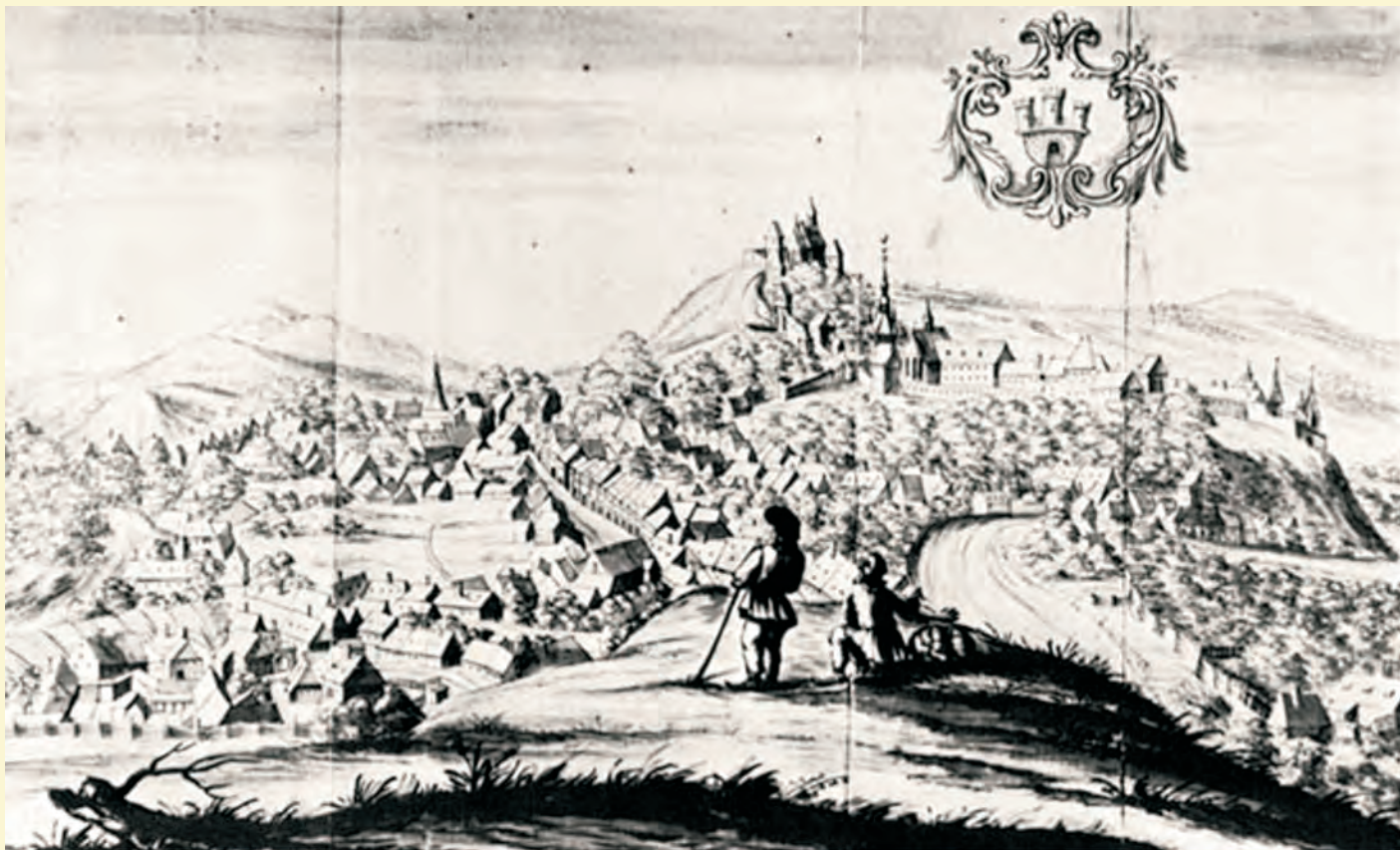
Segesvár látképe keletről. Conrad von Weiss tollrajza (1735)

zett útlevelel menjenek be a városba, a kijelölt útvonalat szigorúan megtartva.