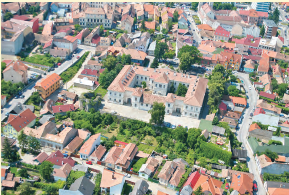
A Hajdú-ágyútorony és a Telegdy-bástya légi felvételen

torony alatt egy korábbi, ívelten húzódó falmaradványt hoztak napvilágra, mely a torony északkeleti oldalánál ma is látható. Az épületelem a Székelytámadt vár előtti építkezések (római castrum, királyi udvarház, középkori kolostor, középkori vár) közül jellege alapján leginkább a Báthori-féle várépítkezéshez köthető. Nem ismerjük pontosan a munkálatok kezdetének idejét, melyek az okleveles adatok alapján csupán 1492-ben kezdődhetek el, ennek ismeretében pedig megállapítható, hogy a kivitelezés csak kis mértékben valósult meg. E szempontból nem mellékes az a tény, hogy a XVI. század második felében és a XVII. század elején nem az egykori várat, hanem a kolostort jelölik meg mint a fejedelmi várépítkezés előzményét.