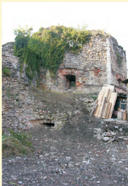
A keleti ágyútorony délről

A szabálytalan négyszög alakú vár a tornyok és bástyák kiugrásaival együtt kb. 105x120 m területet foglal el. Keleti és déli sarkánál egy-egy sokszögű, többszintes, ún. ágyútorony emelkedik. A keleti, a Hajdú-„bástya”, a vár legteljesebb formájában fennmaradt védműve szabálytalan nyolcszög alakú és három szintje van. Emeleteit gerendafödémek tartották, a várbelső felé néző oldala nyitott volt. Az 1620. évi leltár a tornyok tetőszerkezetének koszorúgerendáit is számba veszi, tehát ezek fedve voltak. A torony alsó szintjén három nagyméretű, falba mélyedő ágyúállás található, teherkiváltó árkádívékkel lezárva. A középső, keleti ágyúállásból hármastöré-