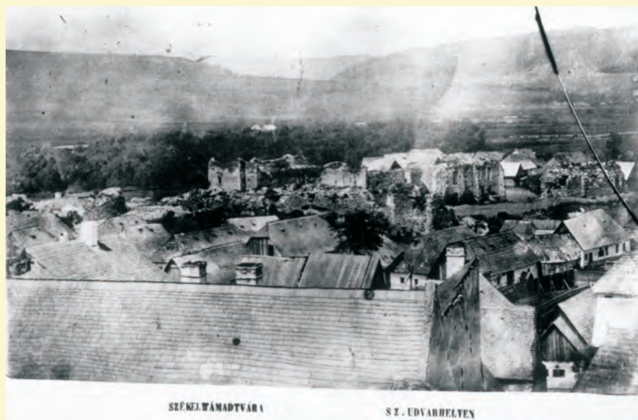
Fénykép 1860-ból, a vár délről

Az inventáriumok részletesen leírják az ún. belső vár épületelemeit, a kolostorból átalakított palota traktusait – ezek térbeliségükben ma már nem tanulmányozhatók, ugyanis az iskolaé-