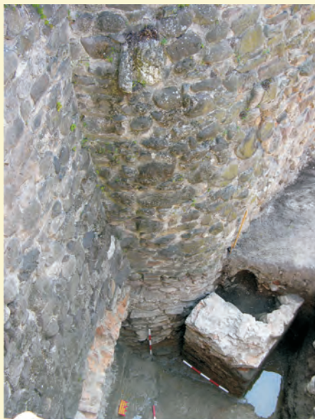
A bejárat küszöbe és a kapuszerkezet rögzítő eleme felülnézetben A szerző felvétele

kapu helyét, a nyugati bástya oldalfalát, benne egy lőrést (?) hoztak napvilágra, hitelesítve Orbán Balázs felmérését. 2009-ben a vár bejárata előtt nyitott szelvényben sikerült feltárni a kapuszerkezet néhány eredeti elemét. 2,25 m relatív mélységben felszínre került a vár eredeti küszöbköve, előtte habarcsos járószinttel. Feltehetően erre a szintre támaszkodott a várárkon átívelő felvonható híd. A küszöböt képező fal irányba egy síkba esik a félkör alakú torony nyugati oldalában eredeti helyzetében lévő rögzítő kő vonalával, melynek segítségével a felvonható kaput vertikálisan működtették. A küszöbkő vonalának függőleges meghosszabbítása a nyugati bástya keleti oldalának falszövetén is kirajzolja az egykori kapuszerkezet lenyomatát. A külső kapu eredetileg tehát egy függőlegesen felvonható szerkezet volt, egyik rögzítő köve a félkör alakú torony nyugati oldalán 3 m relatív magasságban, in situ helyzetben áll ma is. A boltozott kapubejárat legkisebb szélessége 1,60 m, eredeti magassága nem ismert.