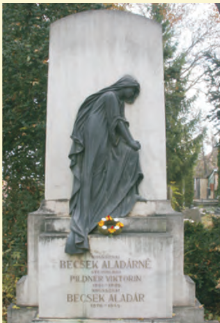
Becsek Aladár sírköve az udvarhelyi református temetőben

17. – 135 éve született Becsek Aladár szerkesztő, a város első nyomdatulajdonosa, az első Udvarhelyi Híradó szerkesztője. (Megh. Bp., 1945. január 15.)