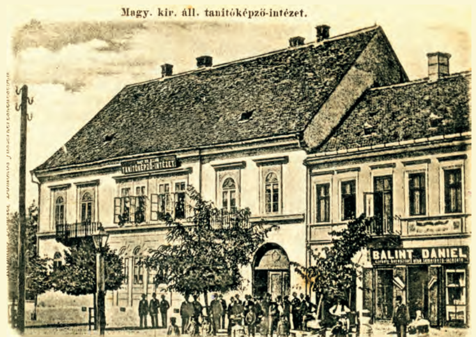
A tanítóképzőnek 1878–1911 között helyet adó épület a Piac téren

1907-ben saját kérelmére nyugdíjba helyezték, de a város zenei életében továbbra is tevékeny részt vállalt. A Szé-