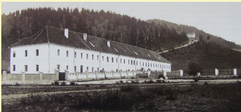
A tanítóképző 1888–1911 közötti épülete Csíksomlyón (archív)

Amikor 1911-ben a katolikus főgimnázium Csíkszeredába költözött, a megürült Pretóriumot a tanítóképző vette birtokba. 11 Úgy tűnt, a számos hurcolkodást megélt félszázados intézet végre megleti helyét. A számításokat azonban keresztülhúzta az első világháború, amely ha-