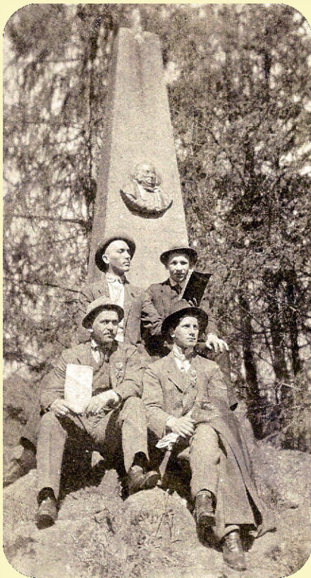
Gimnazista növendékek (köztük a szerző édesapja is) a Magyarósi-emlékoszlopnál 1911-ben

dornál mint házi nevelő dolgozott. Később ugyanott pap lett. Innen hívták meg tanárnak a székelyudvarhelyi Református Kollégiumhoz 1832-ben. Itt 34 évig, 1866-ban bekövetkezett haláláig tanított. Tíz esztendeig volt a kollégium rektora. 1866. szeptember 29-én távozott az élők sorából. Örök álmát a helybeli református temetőben alussza.