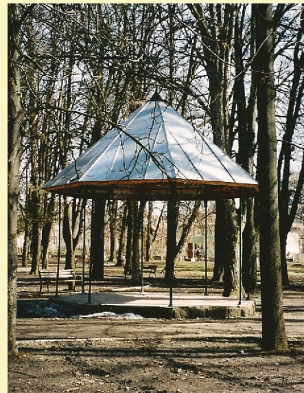
Az egykori zenepavilon

A takarékpénztár a pavilont helyi vállalkozóknál akarta megrendelni, a vállalkozók költségvetése az erre a célra előirányzott 1000 koronát kétszeresen is fölülmúlta, amint erről az Udvarhelyi Híradó 1907. évi júliusi száma is beszámolt. A költségvetés szerint a pavilon pillérei fából, a fedele zsindelekből készült volna. A takarékpénztár nem fogadta el a költségvetést, és ebben az ügyben az aradi vagongyárhoz fordult, mely rendszeresen gyártott ilyen pavilonokat. A gyár ajánlata előnyös volt, mivel csupán 9 koronával haladta meg az előirányzott összeget. A pavilont így az aradi vagongyártól ren-