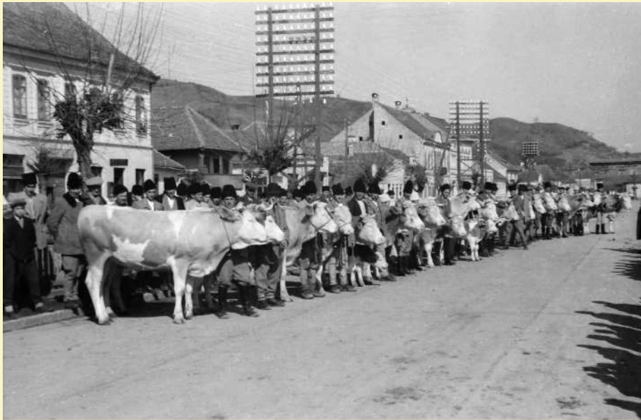
Tenyészállat-kiállítás Keresztúr egykori Piac-terén, 1940-es évek eleje