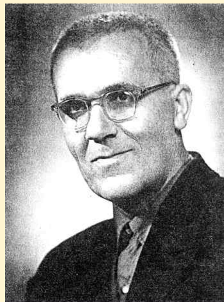
P. Benedek Fidél

22 – 85 éve született Kolozsváron Ferenczi Géza régész. 1954-től húsz éven át az udvarhelyi múzeumot igazgatta. Testvérével, Ferenczi István professzorral vidékünk számos korai várát megásták, ennek eredményeként közös tanulmányokat közöltek. Az utóbbi évtizedben régészettel, művelődéstörténettel (pl. rovásírás) kapcsolatos több önálló tanulmánykötete jelent meg Udvarhelyen: Székely rovásírásos emlékek (tanulmány, 1997), A moldvai ősbib csángók (tanulmány, 1999), Utazások