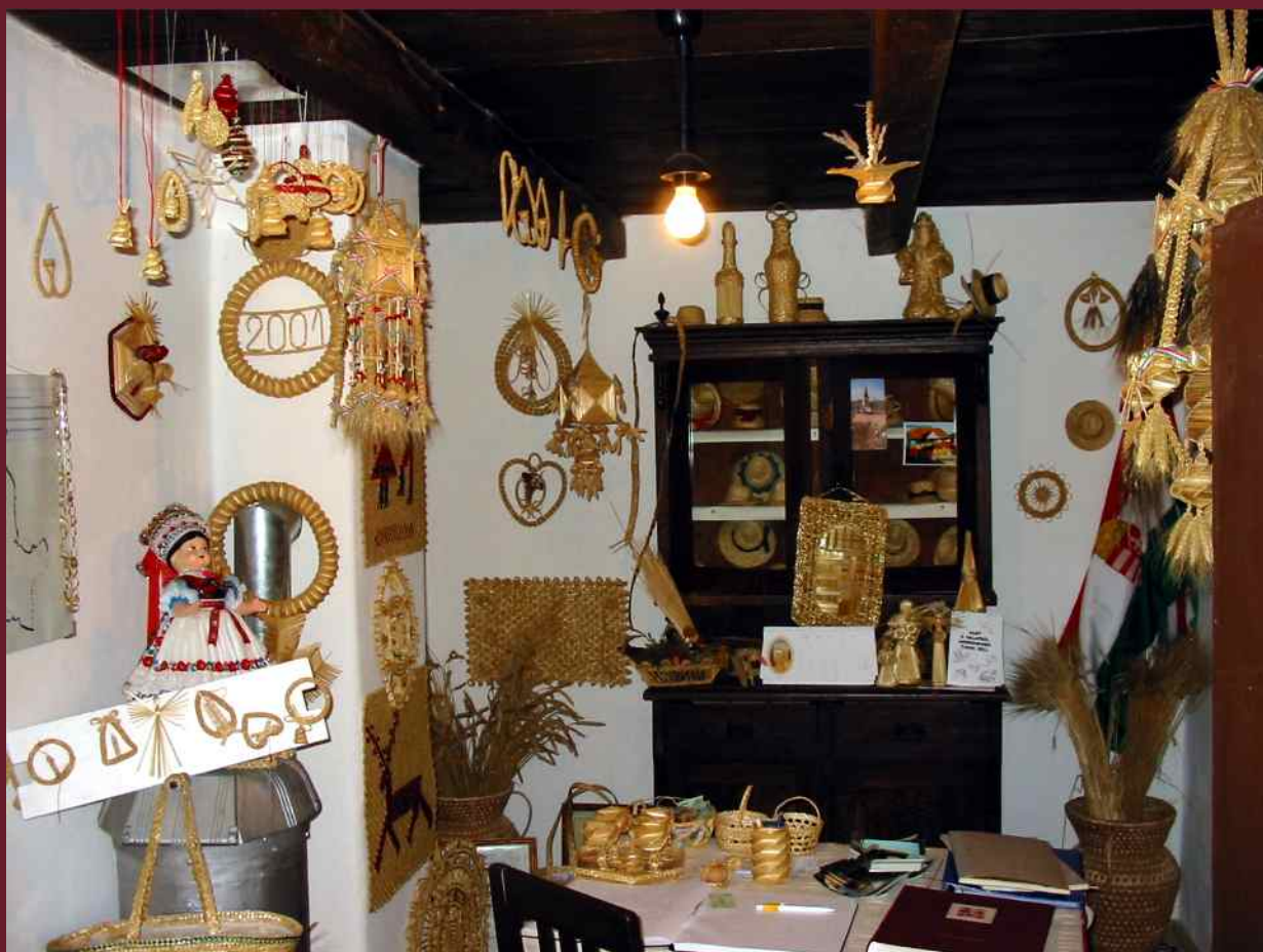
A kőrispataki szalmakalap-múzeum Lásd cikkünket a 22. oldalon