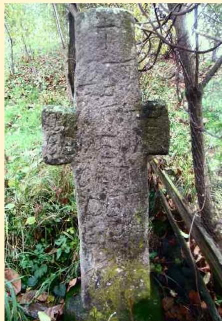
A lövétei kőkereszt