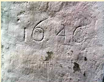
Felirat a homoródkarácsonyfalvi templom támpilléren

De mit is értünk feliratos emlékek alatt? Erre a kérdésre R. M. Kloos, a középkori epigráfia első kézikönyvének szerzője így válaszolt: „feliratos emlékek alatt olyan, különböző anyagokra – kőre, fára, fémre, bőrre, szövetre, zománccra, üvegre, mozaikra stb. – írt szöveget értünk, amelyeket nem az írástanításhoz és a kancelláriai szervezethez tartozó erővel és módszerekkel készítettek.” Tehát a feliratos emlékek közé azok az írásos emlékek tartoznak, amelyek általában nem a szokásos íráshordozóra (papír, hártya), illetve nem a szokásos íróeszközökkel készültek, hanem pl. vésővel.