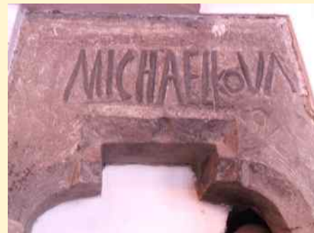
Az oklándi unitárius templomban, a sekrestyeajtó szemöldökrészén található felirat

akkor két felirat kimaradt. Ezek a feliratok (két bibliai idézet) a templom 1996. évi festésekor a diadalíven kerültek elő. A szakemberek szerint a betűtípus és a két szöveget elválasztó ornamentika alapján a famennyezettel (1752-ben készült) lehetnek egyidősök, de az sem kizárt, hogy még a XVII. században készültek. Szövegük: Ha szintén mi vagy az Angyal Menyből hirdet néktek azon kívül á mit hirdettünk átok legyen. Gal. I. V III.; Vigyázatok, maragytok meg hitben emberkegyetek és erősödyetek megh. Cor. XVI. V XIII.