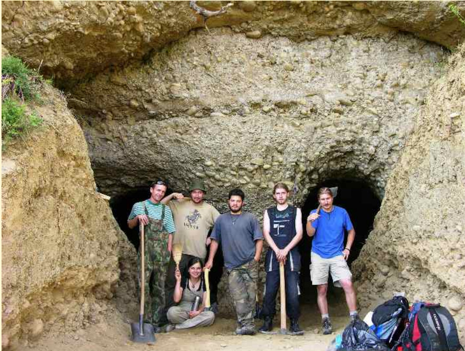
A 2007. évi feltárás résztvevői

nyújthattak az ide menekülő népesség számára. A kutatás jelenlegi szintjén még nem tudunk pontos választ adni arra, hogy mely települések számára biztosított védelmet a barlangcsoport, feltehetően a Telekfalvához közeli kis falvaknak is. Amennyiben kellő mennyiségű víztartalékot tudtak elraktározni, a barlang hosszabb idejű ostromnak is ellen tudott állni. Csekély szerepe lehetett az emberi védelemben a Somoserdő előtt húzódó – véleményem szerint többnyire természetes eredetű – sánc(ok)nak, ugyanis az általuk közrezárt terület a barlangok fölül könnyen támadható volt. Annál inkább közrejátszhatott az állatok megóvásában.