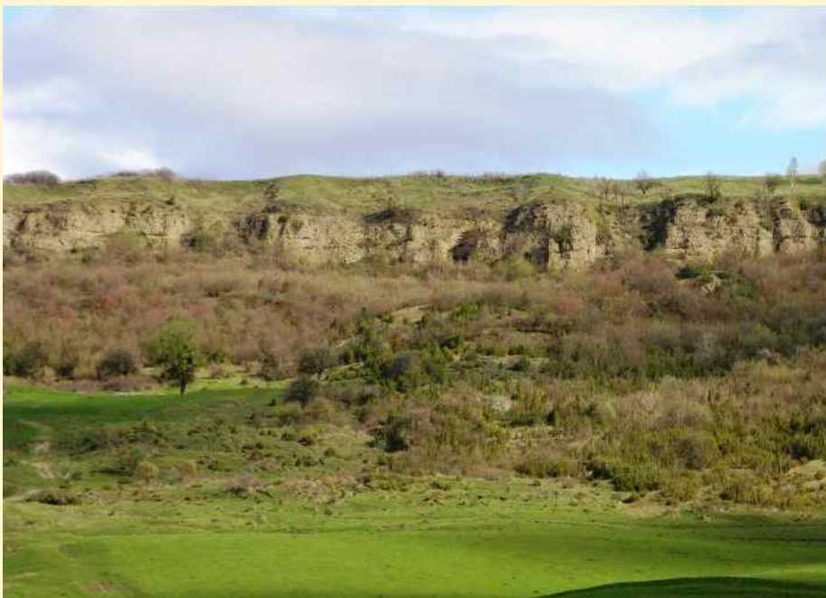
A telekfalvi barlangok a Somoserdő fölött

A telekfalvi barlangrendszer védelmi jellegét ásatási eredményeink is megerősítették. Elhelyezkedésük és fekvésük révén a barlangok végső menedéket