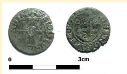
III. Zsigmond lengyel király 1614-es verete