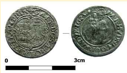
Bethlen Gábor 1623-as garasa

A kronológiai kérdések tisztázásában nagy segítségünkre voltak a túlvilági útravalóként sírba helyezett pénzérmék, melyeket általában az elhunytak jobb kezébe helyeztek. A 28. sírban talált II. Mátyás hamisított dénár (1616), az 50. és 54. sírokban feltárt Bethlen Gábor korabeli, 1623-ban kibocsátott széles garas, valamint 1625-ös, széles veretű dénár alapján az általunk feltárt temető rész csupán pár évtizednyi használatot sugall. Ezt támasztják alá az egyes sírokban megmaradt viseleti tárgyak is: a 30. és 33. számú