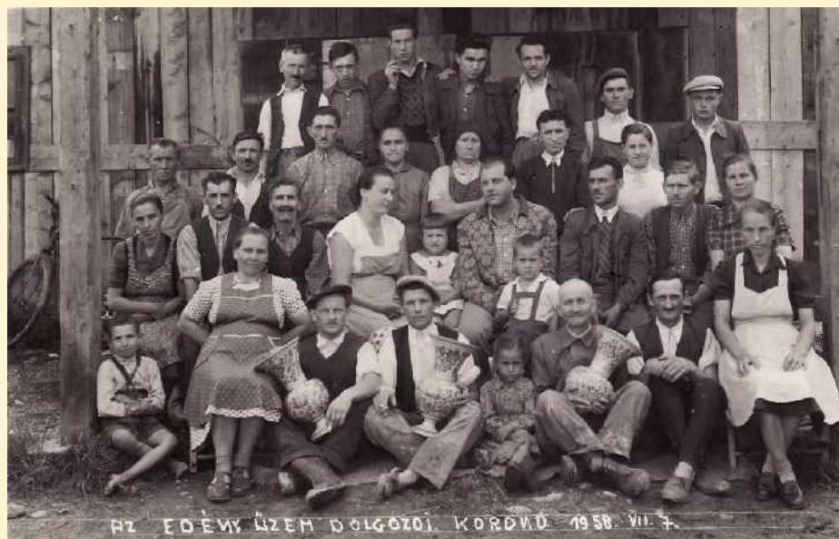
Az edényüzem dolgozói (1958)

A második világháború utolsó évében mindkét üzem beszüntette tevékenységét, a termelést csak 1946-ban kezdték újra. 1948. június 11-én egyik üzemet sem