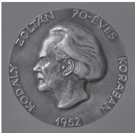
2a. kép: Reményi József: Kodály Zoltán , 1952, bronz, öntött, Ø 97 mm, ZTM ltsz. 10.621

A személyek jubileumaira készült érmek sajátossága, hogy az előlapokon az ünnepelt arcképe, míg a hátlapok többségén a munkásságát idéző ábrázolások vagy allegorikus alakok, jelenetek kapnak helyet. A Kodály 70. születésnapja alkalmából készített érme hátlapja az utóbbira példa. Egy nagyméretű repülő sas hátán egy antikizáló, álló férfialak lyrát emel a magasba. Mellettük felirat: