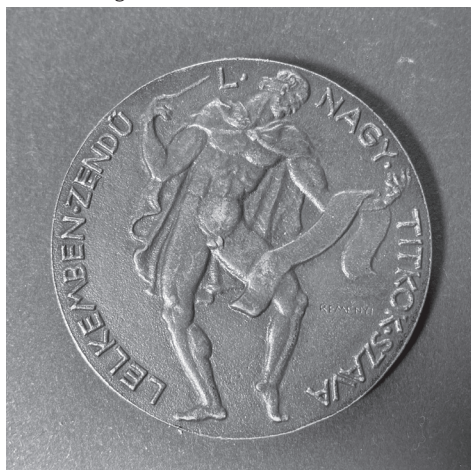
8b. kép: Reményi József: Kerner István , 1923, bronz, öntött, Ø 60 mm, ZTM ltsz. 10.428

A realista megfogalmazású Kerner-érem előlapján a karmester bal profilban ábrázolt portréjának körirata: