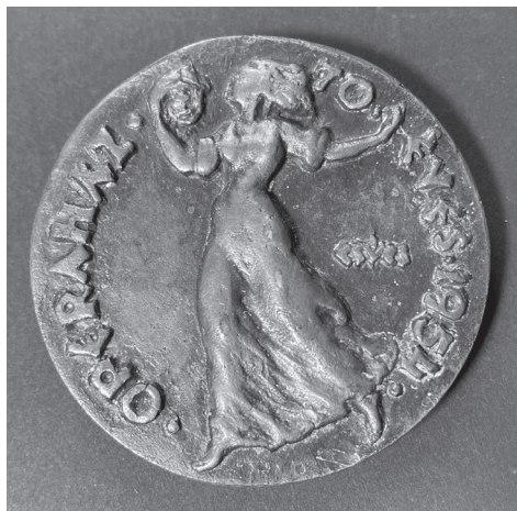
5b. kép: Csúcs Ferenc: Operaház 70 éves 1954 , 1954, bronz, öntött, Ø 72 mm, ZTM ltsz. 10.519

Számos esetben elő- fordul, hogy egy év- ben egyszerre több jubileumot is ünnepel valaki. Demény Dezső és Dohnányi Ernő 50. születésnapja és mun- kásságuk 30. évforduló- ja egybeesett. Demény Dezsőnek (1871–1937), a budapesti Szent Ist- ván bazilika karnagyá- nak, zeneszerzőnek az 50. születésnapjára és