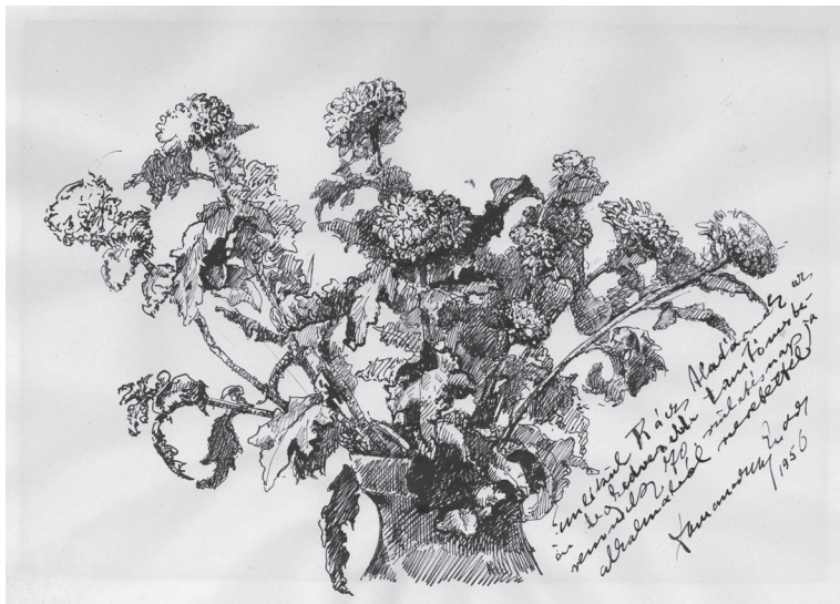
9. kép: Domanovszky Endre: Virágcsendélet , 1956, papír, tollrajz, 170x260 mm, ZTM ltsz. 11.162

Egy ünnepélyes köszöntéshez virágcsokor is tartozik. Így vélekedhet- ett Domanovszky Endre (1907–1974) festőművész is, aki egy csendé- let-grafikával köszöntötte Rácz Aladár (1886–1958) cimbalomművészt (9. kép). A Zenetörténeti Múzeum képzőművészeti gyűjteményébe tar- tozó Virágcsendélet című tollrajzának dedikációja: Emlékkül Rácz Aladár- nak, az én legkedvesebb tanítómesteremnek 70. születésnapja alkalmából szeretettel: Domanovszky Endre 1956.