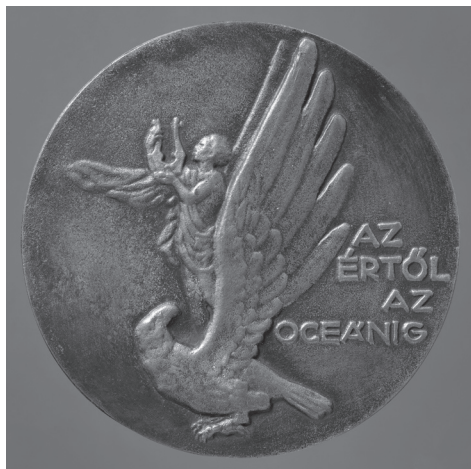
2b. kép: Reményi József: Kodály Zoltán , 1952, bronz, öntött, Ø 97 mm, ZTM ltsz. 10.621

A kétoldalas érmehez hasonlóan megmintáztott egyoldalas érme is készült 1952-ben Kodály Zoltán profiljával, de ennek köriratán nem említik a születésnapot. 3 Szintén nem a kerek évforduló alkalmából, de azonos évben készült el Kodály Zoltán és Sándor