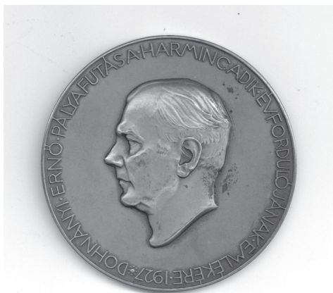
7a. kép: Reményi József: Dohnányi Ernő , 1927, bronz, vert, Ø 65 mm, ZTM ltsz. 10.089

egy ünnepi est keretében. A közönség három Dohnányi-művet hallgatott, a C-dúr szerenád ot (op. 10), az A-moll vonósnégyst et (op. 33) és a szerző közreműködésével a C-moll zongora kvintettet et (op. 1). Külön kiemelendő, hogy az egyébként 15 pengő árú Reményi-érmét a két ünnepi hangversenyen résztvevők 5 pengőért vásárolhatták meg. A harmadik jubileumi eseményt az Operaházban tartották, díszelőadásban adták elő Dohnányi a Vajda tornya című 1922-ben bemutatott kétfelvonásos operáját. 15