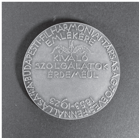
3b. kép: Reményi József: A Budapesti Filharmóniai Társaság 70 éves fennállása emlékére , 1923, bronz, öntött, Ø 60 mm, ZTM ltsz. 10.472

zenei intézmények a 20. század elején és közepén ünnepelték fennállásuk 70. évfordulóját, amelyekről több esetben érmeikkel vagy plakettel is megemlékeztek.