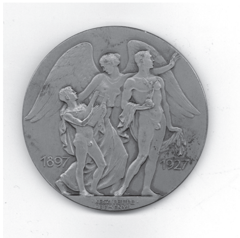
7b. kép: Reményi József: Dohnányi Ernő , 1927, bronz, vert, Ø 65 mm, ZTM ltsz. 10.089

egy ünnepi est keretében. A közönség három Dohnányi-művet hallgatott, a C-dúr szerenád ot (op. 10), az A-moll vonósnégyst et (op. 33) és a szerző közreműködésével a C-moll zongora kvintettet et (op. 1). Külön kiemelendő, hogy az egyébként 15 pengő árú Reményi-érmét a két ünnepi hangversenyen résztvevők 5 pengőért vásárolhatták meg. A harmadik jubileumi eseményt az Operaházban tartották, díszelőadásban adták elő Dohnányi a Vajda tornya című 1922-ben bemutatott kétfelvonásos operáját. 15