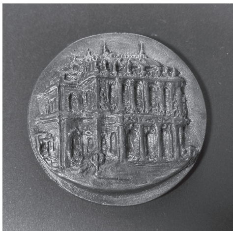
5a. kép: Csúcs Ferenc: Operaház 70 éves 1954 , 1954, bronz, öntött, Ø 72 mm, ZTM ltsz. 10.519

ról (5. kép). Csúcs munkáinak jellemzője, hogy a síkból magasan kidomborodóan, rendkívül plasztikusan mintázza meg formáit. A jubileumi érme- nek előlapján az Operaház főhomlokzata tömörszerűen emelkedik ki az érem lapjából, szinte teljesen kitöltve a rendelkezésre álló teret. A hátlapon a kö- zépen álló, maszkot tartó nőalak harmonikus kom- pozíciót alkot az érem kör- iratával (OPERAHÁZ • 70 • ÉVES • 1954).