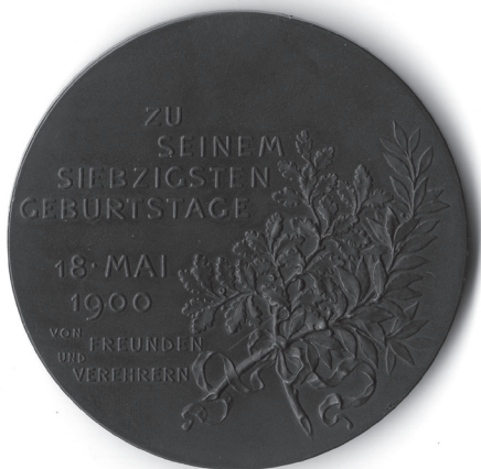
1b. kép: Anton Scharff: Goldmark Károly, 1900, bronz, vert, Ø 64 mm, ZTM, ltsz. 10.460

Miklós magánkollekciónak került a gyűjtemény kezelésébe, több más kiváló éremmel együtt. A sötét patinájú érem előlapján Goldmark látható, a hátoldalon pedig a babér- és olajágak melletti német szöveg a készítés alkalmát jelöli: ZU / SEINEM / SIEBZIGSTEN / GEBURTSTAGE / 18 • MAI / 1900 / VON / FREUNDEN / UND / VEREHRERN. A jeles esemény alkalmából 1900. május 19-én a Magyar