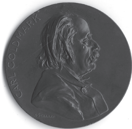
1a. kép: Anton Scharff: Goldmark Károly , 1900, bronz, vert, Ø 64 mm, ZTM, ltsz. 10.460

A Múzeum gyűjteményében két éremművészeti alkotás is megtalálható, amelyek zeneszerzők 70. születésnapjára készültek. 1900-ban a Bécsi Zenekedvelők Társasága készítettett emlékérmeket Anton Scharff (1845–1903) szobrásszal, éremművésszel Goldmark Károly (1830–1915) zeneszerző születésnapja alkalmából (1. kép). A múzeumi darab Auer