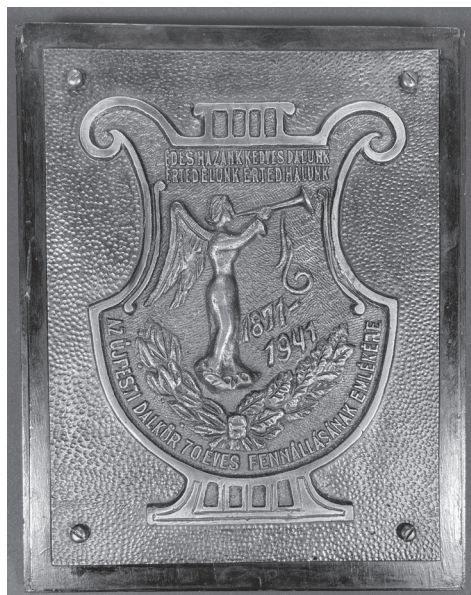
4. kép: Ismeretlen művész: Újpesti Dalkör 70 éves fennállásának emlékére, 1941, bronz, öntött, 230x155 mm, ZTM ltsz. 11.522

vészi kivitelű emlékérem első példányát szeptember 21-én adták át Fodor Izsó (1872–1931) hegedűművésznek, a zenekar tagjának 25 éves jubileuma alkalmából. Az október 8-án tartott díszhangversenyen osztották ki a további érmeket olyan művészek és mecénások között, akik a Filharmóniai Társaság körül különös érdemeket szereztek. 5 Az 1923/24-es évadban négy filharmóniai koncertet tartottak a Nemzeti Múzeumban, ahol kezdetekben, a Vigadó felépülése (1865) előtt