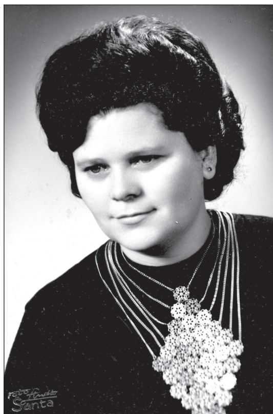
Anyám tablóképe (Szabadka, 1971)