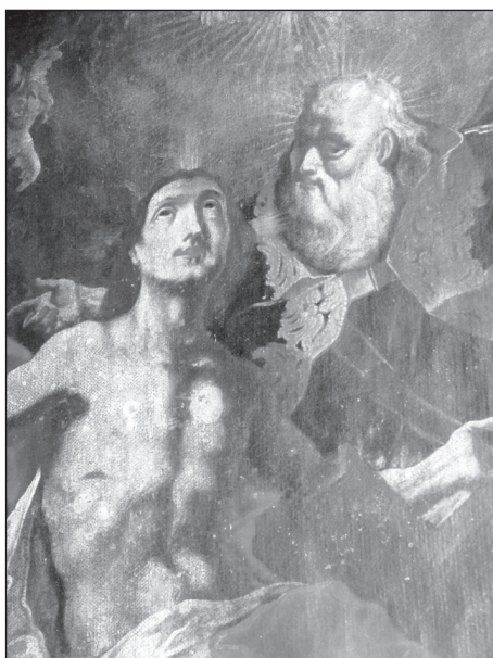
Szenzer-műhely: Szentháromság, 1740-es évek, a bácsújfalusi első plébániatemplom egykori főoltárképének részlete

említik először, amikor mint még eszéki festő megtisztította a pécsi székesegyház Szent Imre festményét. Szenzer 1747-ben kap polgárjogot Pécsen, s a harmincforintos illeték helyett megfesti Justitia alakját. Az egyházi megrendelések mellett, melyekhez a kor szokása szerint grafikai előképeket használt, Szenzer polgári és nemesi családoknál festett arcképeket, melyek közül csak egyet, Berényi püspökét ismerjük 1745-ből. Alkotásaival az egykori pécsi püspökség templomaiban találkozhatunk: Pécs, Siklós, Máriagyűd, Eszék, Vukovár, Diakovár, Bród, viszont a ferences kapcsolatoknak köszönhetően a Száva túloldalára, Kraljeva Sutjeskába és Visokóba is eljutottak művei (REPANIĆ BRAUN 2004: 174). Ezen a ferences vonalon került kapcsolatba a Bácskával is, a bácsi ferences templom részére 1753-ban festi meg a Pádúai Szent Antal mellékoltárképet és a Szent Vendel predellaképet, mely utóbbit 1991-ben ellopták. Ugyanitt őrzik Szent Rókus festményét is, melyek sikeres restaurálásukat követően (2007/2008) visszahelyezték a Nagyboldogasszony-templom mellékoltárait. A bácsi rendház Szent Didák megdicsőülését ábrázoló művét is Szenzer műhelyének tulajdoníthatjuk. A ferencesek által egykoron vezetett szelencsei első kis vályogtemplom Szentháromság oltárképe is a pécsi mesternek attribuítható, mely alapján képet alkothattunk falusi templomainak az 1740-es években készült eredeti berendezéseiről, melyek szinte kivétel nélkül megsemmisültek, elkallódtak az idők folyamán (KORHECZ PAPP 2009).