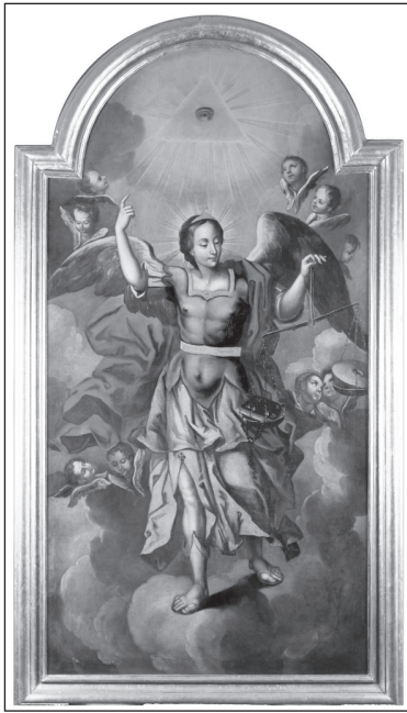
Stettner Sebastyán: Szent Mihály arkangyal, a mennyei seregek fővezére (1741, a szabadtéri ferences templom egykori háromemeletes főoltárának képe)

utóbbiét 1774-ben Falkoner Ferenc (1737–1792) budai festő magasabb minőségű műve cserélték. A zombori ferencesek központi budai templomukon keresztül juthattak első oltárképeikhez, melyek budai illetőségű mestereinek nevei jelenleg még ismeretlenek (KAIZER 1932: 44).