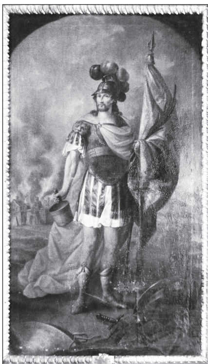
Schöfft József: Szent Flórián (1810 körül, a bácsi Szent Pál-plébániatemplom egykori mellékoltárképe), római vértanúhoz tűzvész ellen fohászkodtak

Doroszló, Jánoshalma, Monostorszeg, Szépliget templomaiban tekinthetjük meg műveit (KORHECZ PAPP 2013).