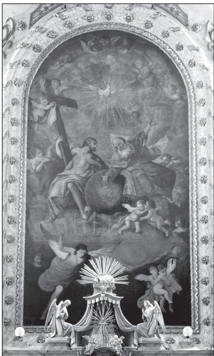
Kronovetter Pál: Szentháromság, 1784, a zombori Szentháromság- templom főoltárképe

nak köszönhetően a bajai ferences templom mellékoltárain hat alkotását azonosítottuk, s a nyolc refektóriumai ferences portrét és a Jótanács Anyja kegyképet is opusába sorolhatjuk immár (KORHECZ PAPP 2011: 73–88). Fiának, Falkoner Józsefnek három főoltárképével találkozhatunk a Bácskában: Kishegyesen, Béregen és Szondon, de a feldúlt szerémségi Kukujevci templomának Fájdalmas Szűzanya oltárképe is az ő munkája (ŠKORIĆ 2009: 100).