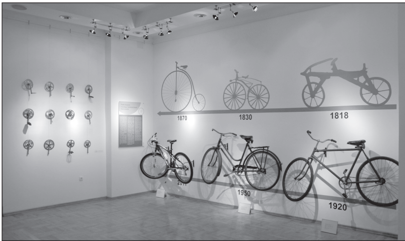
A kerékpár fejlődéstörténete. Szabadkai Városi Múzeum, 2011

A kiállítás a Szabadkai Városi Múzeum épületének első emeletén volt látható. A látogató számára a kiállítás helyszínét már a földszinten, az információs pult és a jegypénztár közelében padlóra ragasztott zöld kerékpáros legendák jelezték, amelyek végigkísérték az egész kiállítást a javasolt haladási irányt mutatva. Az első teremben a kerékpár fejlődéstörténetének a bemutatása után lehetőséget biztosítottunk, hogy a látogató szabadon válasszon útvonalat részben a Sport, szórakozás és életmód – A kerékpározás 130 éves szabadkai múltja , illetve Kerékpár a szabadkai képzőművészetben tematikákat feldolgozó kiállítási egységek között. A sport, a szórakozás és az életmód egységen belül a következő tematikus alegységek szerepeltek: