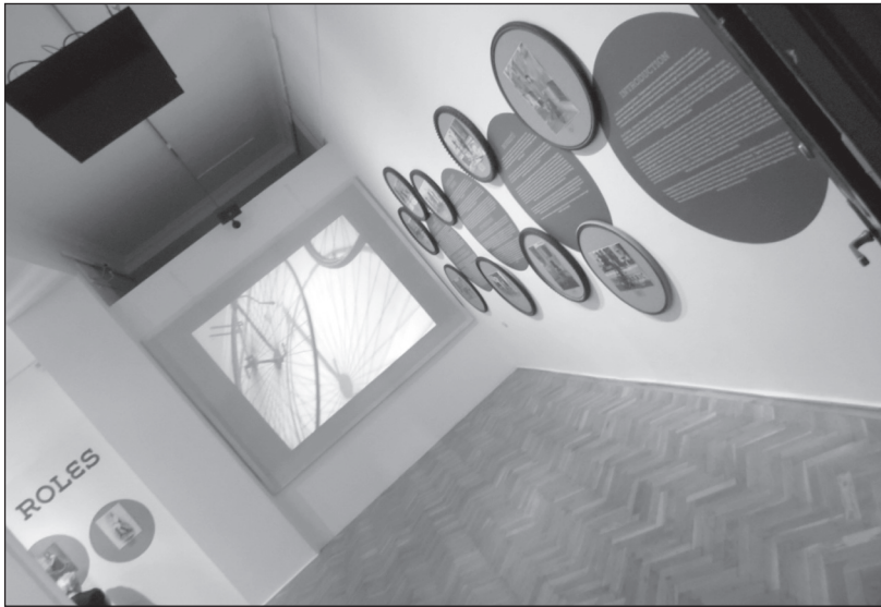
Impresszumfal és kivetítő a budapesti kiállítás bevezető installációnál

A térinstallációk között találunk makettet, vitrint (érmék, dokumentumok, plakátok, műtárgyak, ékszerek elhelyezésére), érintőképernyőt és más változatos kiállítási formát egyaránt. Szimbolikusan közös modellje jelenik meg a szabadkai Vermes-féle kerékpárpályának és a budapesti Millenáris Velodromnak. Az eredetileg ívesre és a nézőtől a fal felé emelkedő szintűre tervezett makett háttérében palicsi, szabadkai és budapesti épületek sziluettjei láthatók.