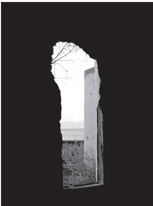
Számunkban Kelemen Emese fotóit közöljük