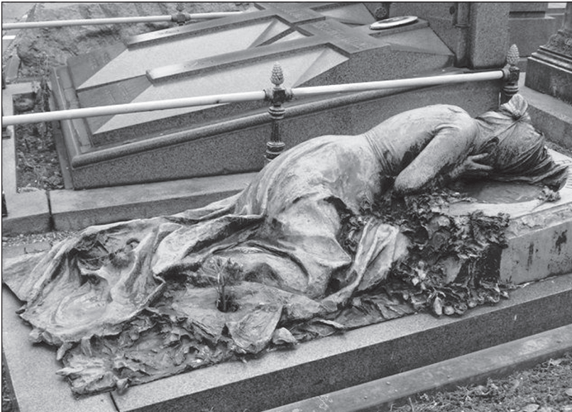
Cimitero Monumentale sírszobra, Milánó

Milánó halott városa, a Cimitero Monumentale sírszobrai időtlenségében megelevenednek a gyolcs redői a rájuk nehezülő idő alatt, a legendák s titkok beleivódnak, finom filmréteget vonnak a bronzra. Az alvó kertben 1955 és 1971 között pihent Eva Duarte Peron Maria Maggioro néven. Még mielőtt mauzóleuma elkészült volna, a peronizmus ellen fellépő új diktatúra elrejtette testét a nyilvánosság elől, személyének miszticizmusa, vagy az először itt eltemetett Giuseppe Verdi legendás emléke végigkísér az árkádok alatt. A szobrok mesélnek, fizikai világuk elhalványul, tényleges értékük nem csak az élő organizmusként terjedő korrózióval mérhető, az idő játéka, amelyben megelevenedik az élettelen fém, együtt változik a megváltoztató közegével. A jellegzetes szín, a New York-i Szabadság-szobrot meghatározó sápadtzöld patina vagy csak a pécsi, budapesti, bécsi utcákon sétálgatónak már fel se tűnő elszíneződés oly mértékben beleivódott a tudatba, hogy emblematizált voltának megváltoztatása immár elképzelhetetlen.