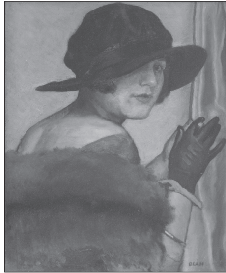
Oláh Sándor: Feleségem arcképe (1920)