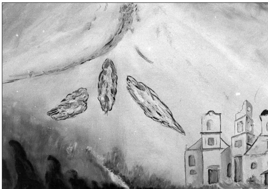
Novák Mihály: Baranyai templomok