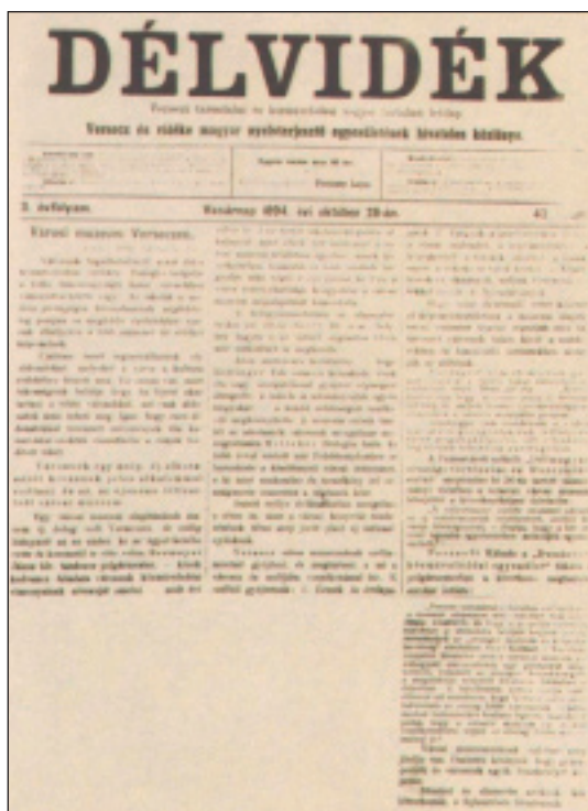
A Verseci Múzeum megnyitására szóló cikk a Délvidék 43. számából, 1894

Intézményrendszerüket is megteremtették. Az Országos Történelmi Társulat megalakulása után már 1872-ben Temesváron létrejött a Dél-Magyarországi Történelmi és Régészeti Társulat, majd 1878-ban szintén Temesváron a Délmagyarországi Múzeumegyesület. E két társulat 1885-ben egyesült, és felvette a Dél-Magyarországi Történelmi és Régészeti Múzeumtársulat nevet. Kezdetben egész Dél-Magyarországra kiterjesztette működését, majd amikor 1883-ban Zomborban megalakult a Bács-Bodrog Vármegyei Történelmi Társulat, tevékenységét Temes és Torontál, részben pedig Krassó-Szörény vármegyékre korlátozta. 9