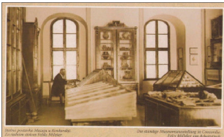
A tudós a munkasztánál

A Magyar Antropológiai és Archeológiai Társaságban is aktívan közreműködött. A Német Prehisztorikus Társulat egyik megalapítója Berlinben, valamint tagja az újvidéki Szerb Matica Közművelődési Társaság Tudományintézetének. Eközben a verseci gimnáziumban történelmet és földrajzot adott elő. Munkássága a városrendezési megmozdulásokon is kifejezésre jutott, így tiszteletbeli elnökké választották. Megírta a verseci park történetét is az 1775 és 1927 közötti időszakban. 16