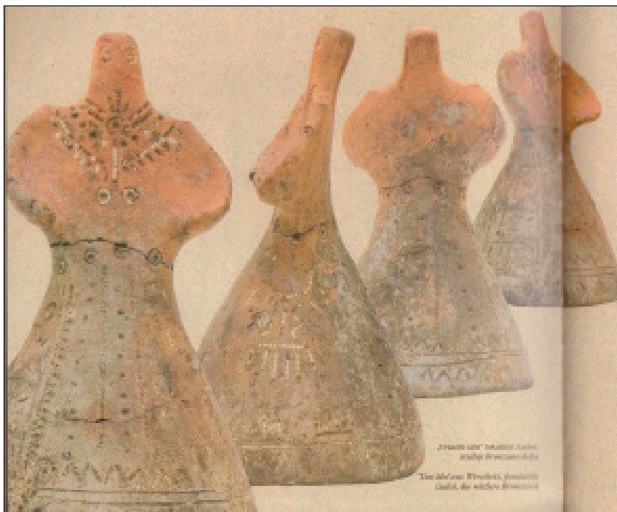
A Verseci bálvány

Az agyag antropomorf (ember alakú) figura fejét nem díszítette az alkotó, ám a figura öltözékéből kivehető a hosszú, harangszerű szoknya, melyet valószínű nehéz gyapjúból szőttek. Különféle karcolási mintázattal, rojtok ábrázolásával egészítették ki a részleteket. A felső testrészen nyakékek és a felsőruha mintázata látható aprólékosan kidolgozva. Arra a megállapításra jutottak a kutatók, hogy e társadalom igencsak pompakedvelő volt. A figurák szimbolikus jelentőséggel bírtak. 26