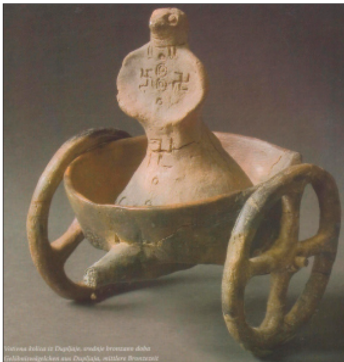
A Temesváralján (Dupljaja) talált kocsi

Temesváralja (Dupljaja) Fehértemplom (Bela Crkva) község Vár nevű lelőhelye magaslaton fekszik a Karas folyó mellett. Rómer Flóris (1815–1889) régész, a magyar művészettörténet úttörője, a Magyar Nemzeti Múzeum régiségtárának igazgatója volt. Átutazóban érdeklődését felkeltette Bánát délkeleti csücske. 27 Ezen a helyen Milleker 1897-ben végzett leletmentést. A legértékesebb régészeti kincs két kisméretű, kultikus áldozati szoborcsoport, mely dupljajai kocsi néven vált ismertté. A nagyobb példányt a belgrádi Nemzeti Múzeum vásárolta meg, a kisebb a Verseci Múzeumba került. Az első kerámia 13,4 cm magas és 21,9 cm hosszú, az i. e. 2. évezred közepéről származik. Az antropomorf figura madárra emlékeztető fejjel három mocsári madár által húzott kocsin áll. A háromkerekű kocsi kerekén négy szépen kidolgozott küllő látható. 28 A figura a fény istenét ábrázolja. Feltételezik, hogy a fej mellett egy napot ábrázoló korong állhatott. E kisplasztika jelentőségénél fogva a legismertebb régészeti leletté vált Vajdaság területéről. A II. világháború utáni Jugoszláv Régészeti Társaság védjele volt. 29