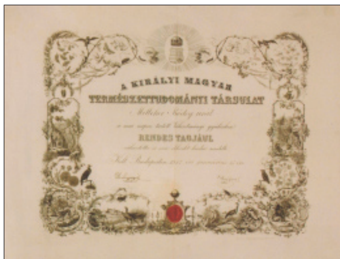
A Természettudományi Társulat tagságáról szóló diploma