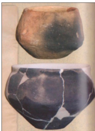
A porányi kerámiák

Két ízben (1910-ben és 1934-ben) rendeztek kiállítást e témára. Érdekes megjegyezni, hogy a gyufa feltalálása előtti időszakban kincset értek azok a kőzetek, amelyekkel tüzet lehetett csiholni. Innen ered a határrész tűzkőre visszavezethető neve.