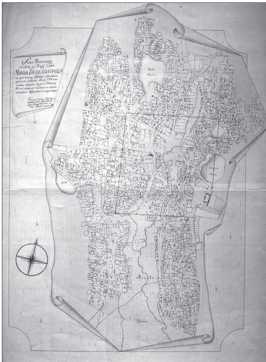
Kovács Károly Leopold 1778-ból származó kéziratoss Szabadka-térképe (DUBAJIĆ 1991, 7/a melléklet)