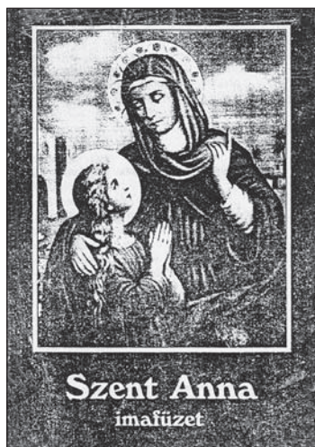
A Szent Anna imafüzet címlapja