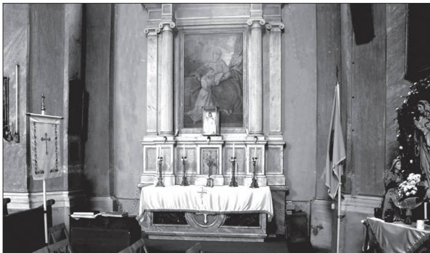
A csókai Szentháromság-templom Szent Anna-mellékoltára