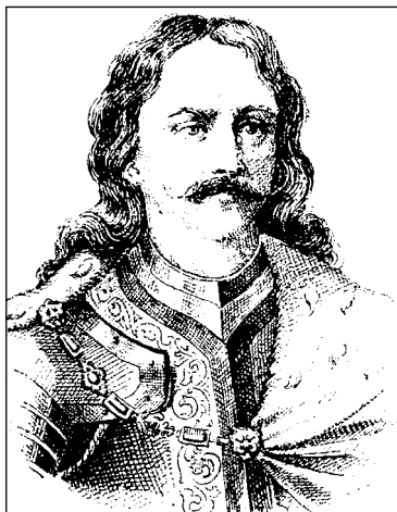
Hunyadi János/Sibinjanin Janko

Állapítsuk meg tehát záradékol, hogy a két pápa, III. Calixtus és VI. Sándor volt a törökellenes harangozás elrendelője; az első egyik bullájában, a másik e bulla alapján kiadott szentszéki rendeletében. E történeti tények egyáltalán nem kisebbítik Hunyadi és Kapisztrán fényes nándorfehérvári haditettének súlyát és jelentőségét, a déli harangszó győzelmükhöz nemesedő félezer éves hagyománya ugyanis annak bizonyítéka, hogy az emlékezet évszázadokig, még a közbeeső másfél évszázadnyi török hódoltság ideje alatt is, számon tartotta a győzedelmes csata tényét.